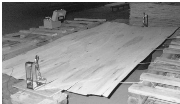
Figura 2. Obtenção da rigidez das lâminas e módulo de elasticidade dinâmico pelo stress wave timer . Figure 2. Obtenção of veneers stiffness and dynamic modulus of elasticity by stress wave timer.

A figura 2 apresenta o método utilizado para obtenção da rigidez das lâminas através do stress wave timer . Os transdutores foram posicionados no centro de cada lâmina avaliada.