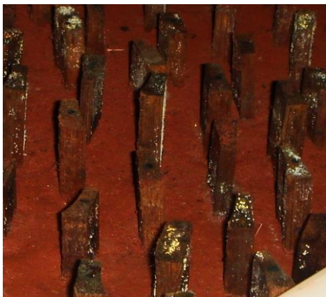
Figura 2. Corpos de prova após 6 semanas de exposição ao ensaio de degradação acelerada. Figure 2. Specimens after 6 weeks of exposure to accelerated decay test.

Decorridas 6 semanas iniciais do ensaio, a inspeção visual das taliscas não evidenciou alterações importantes devidas à uma possível degradação por fungos, sendo perceptível apenas uma colonização superficial por fungos emboloradores em todas as taliscas (Figura 2).