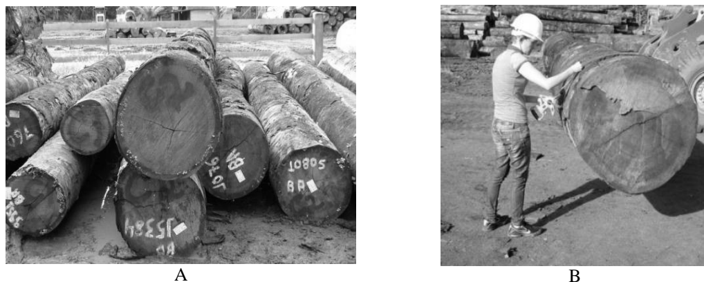
Figura 1. Classificação das toras por classes diamétricas (a) e medição do volume (b). Figure 1. Logs sorting in diametric classes (a) and volume measuring (b).

concessão. As toras, que apresentavam comprimentos variados entre 4,30 e 9,30 metros, foram escolhidas aleatoriamente no pátio da empresa e divididas em quatro classes diamétricas por espécie (Figura 1A), cada classe contendo cinco toras, totalizando um número amostral de 60 toras, conforme a tabela 1. Foram utilizadas toras de comprimentos diferentes, para seguir o processo de produção da empresa, que trabalha com diversos comprimentos de tora, não havendo classificação das mesmas para o desdobro.