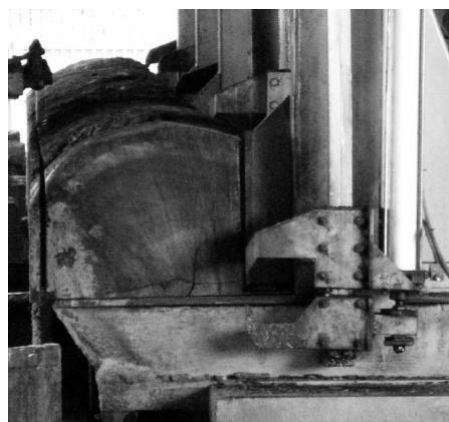
Figura 2. Desdobro principal na serra de fita para toras livres de defeitos. Figure 2. Non defect logs breakdown using a band saw.