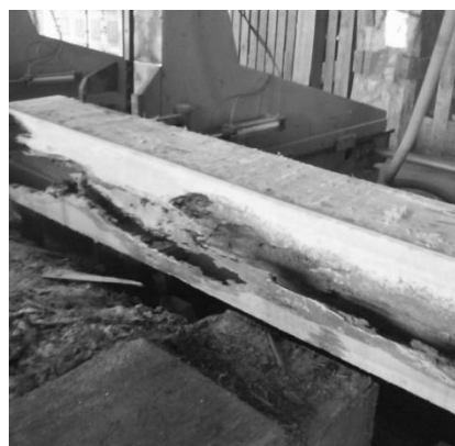
Figura 3. Desdobro principal na serra de fita para toras com defeitos. Figure 3. Defective logs breakdown using a band saw.

Para o cálculo de eficiência técnica, primeiro foi obtido o volume das toras para cada classe diamétrica. De posse desses volumes, foi feito o desdobro das mesmas, cronometrando-se o tempo desde o carregamento do carro porta-toras da primeira tora da classe 1, parando-se o cronômetro na quinta tora dessa classe, sem intervalo entre uma tora e outra. Repetiu-se o processo para a classe 2, classe 3 e classe 4 do jatobá, e assim sucessivamente para a muiracatiara e a muirapiranga. O tempo foi registrado para cada classe e utilizado para o cálculo da eficiência técnica na fórmula abaixo (2). Esse processo foi realizado separadamente para cada espécie.