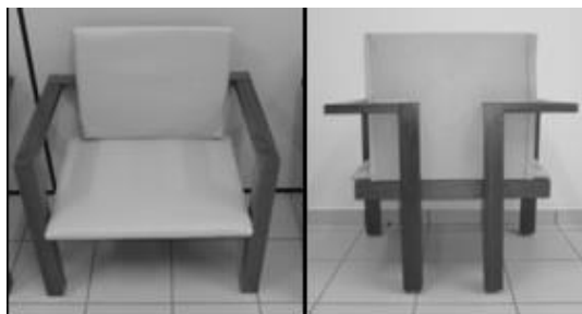
Figura 1. Poltrona produzida com madeira de Tauari-vermelho. Figure 1. Armchair produced with wood Red-Tauari.

Para a coleta de dados, foi realizado um estudo de caso no Laboratório-marcenaria da Universidade Federal do Amazonas, o qual dá suporte aos trabalhos acadêmicos de graduação e pós-graduação. Foram produzidas poltronas com madeira (Figura 1) da espécie Cariniana micrantha Ducke (SCHLESER et al. , 2015), conhecida popularmente como Tauari-vermelho – árvore da família das Lecythidaceae , sendo escolhida devido à grande abundância nas madeiras da Cidade de Manaus bem como também por ser uma madeira não tão apreciada para a produção de móveis e artefatos, sendo mais utilizada na construção civil, como escora para lajes, produtos de baixo valor agregado.