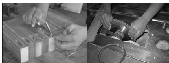
Figura 3. Medição dos furos para encaixe das espigas com uso de paquímetro (à esq.) e setup da serra circular (à dir.). Figure 3. Measurement of holes to plug the ears with a caliper (left.) And set the circular saw (right.).

A furação também apresenta valores de tempo para setup e medição muito discrepantes. Cerca de 68% é consumido por setup 's e medições. Mais de 31% da atividade é consumida pela operação de medição das peças para furação, necessária até então por não ter uma respigadeira que realiza o trabalho facilmente, fazendo com que a agregação de valor ao produto seja muito baixa (Figura 3).