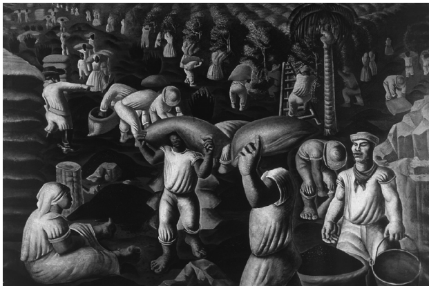
Café. Cândido Portinari, 1935. Pintura a óleo sobre tela de tecido. 1,30 m de altura por 1,95 m de largura.

Os camponeses foram fontes de inspiração para Portinari compor suas obras, reconhecidas e respeitadas internacionalmente. Muitas das suas pinturas retrataram a vida no campo, as esperanças dos trabalhadores rurais brasileiros. “Cândido Portinari é uma expressão constante e fiel de nossa cultura, porque traduz, em sua arte, as dores e as esperanças de nosso povo” (FABRIS, 1990, p. 37). Observe a pintura a seguir: