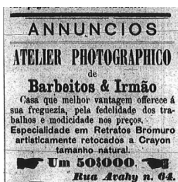
FIGURA 2 – ANÚNCIO