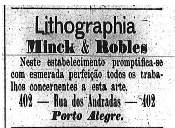
FIGURA 3 – ANÚNCIO