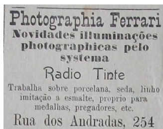
FIGURA 1 – ANÚNCIO

As fotografuras de afrodescendentes no jornal O Exemplo não referem a autoria do fotógrafo. No entanto, localizamos no jornal anúncios do estúdio Ferrari e do atelier fotográfico Barbeitos e Irmãos, localizado na Rua Avay, nº 64, que como sugere o anúncio era especializado em retratos. Esses dois fotógrafos foram, provavelmente, os responsáveis pelos retratos de afrodescendentes veiculados no jornal. Também a litografia Minck e Robles, como sugere a errata reproduzida abaixo, era uma alternativa para as ilustrações do jornal O Exemplo .