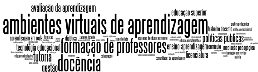
FIGURA 4 - DIAGRAMA DE DISTRIBUIÇÃO DOS DESCRITORES ATRIBUÍDOS ÀS 83 TESES SOBRE EaD, COM BASE EM ANÁLISE DOS SEUS TÍTULOS E RESUMOS

Todavia, percebemos uma sensível diferença na disposição gráfica dos termos da Figura 4, resultante da análise de cada título e resumo das 83 teses.