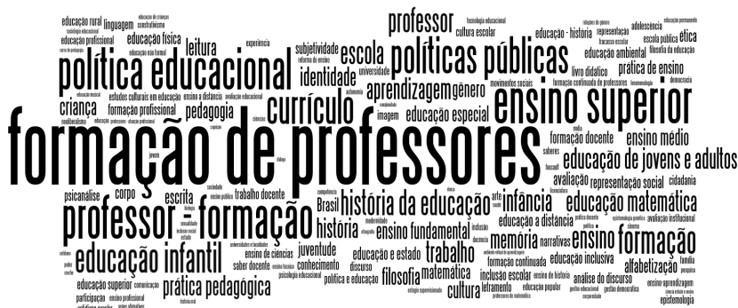
FIGURA 2 – DISPOSIÇÃO GRÁFICA DAS RECORRÊNCIAS DOS TERMOS-CHAVE EM TODAS AS TESES CATALOGADAS NA BASE DO GRUPO HORIZONTE

Podemos observar que os dez termos mais evidentes são, em ordem decrescente de aparição: formação de professores ; ensino superior ; professor-formação ; política educacional ; políticas públicas ; currículo ; educação infantil ; formação ; história da educação e professor . Juntos, esses termos representam 1.188 recorrências, o que equivale a 7,76% do total de recorrências e 34,25% do total de termos.