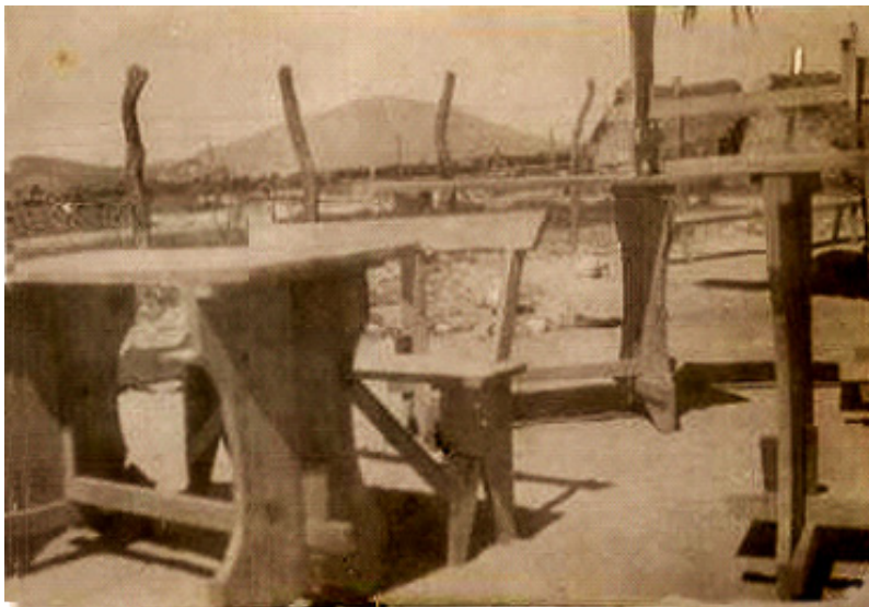
FIGURA 4 - MESA-BANCOS DE MADERA CONSTRUIDOS PARA LA ESCUELA “LA POZA”, SAN FRANCISCO DE LOS BLANCOS, GALEANA, NL., 1932 FUENTE: AHSEP/DMC.

Al interior del salón de clase se contaba también con una mesa-escritorio para el maestro y una silla, un pizarrón negro con bordes de madera, aunque en escuelas más humildes se reportaba que el pizarrón era una tela de manta