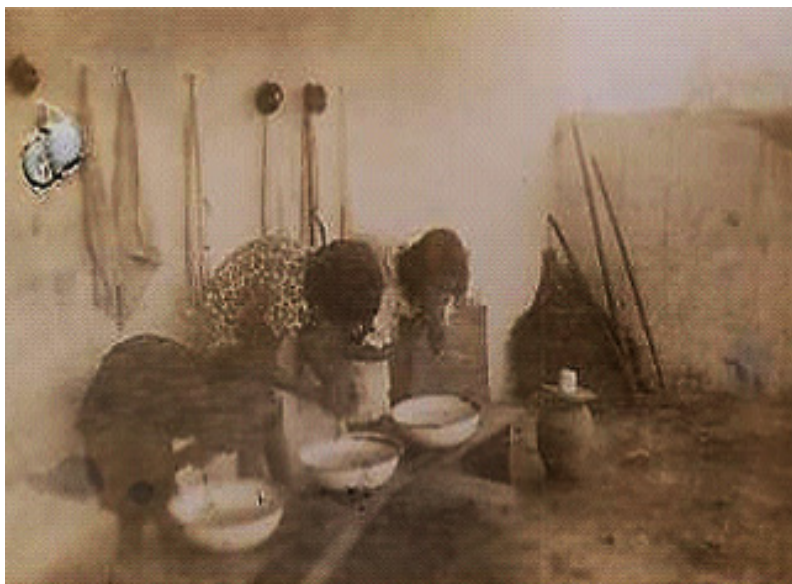
FIGURA 7 - LAVABOS “LOMA PRIETA”, MONTEMORELOS, NL., 1939

Una más de las construcciones de las escuelas rurales fueron los baños y lavabos, indispensables para la higiene infantil. Dentro del proyecto educativo rural la higienización campesina fue fundamental para evitar las enfermedades y la proliferación de bacterias, de ahí que la prevención a través de la higiene y las campañas de vacunación, de quema de basura, de desecación de pantanos y agua estancada, “el día del baño”, entre otros programas, pretendían mejorar las condiciones de salud de los campesinos, sobre todo en los lugares donde el agua escaseaba. Como ejemplo, la siguiente foto muestra la inauguración de los lavabos, que consistía en ollas metálicas sobre una mesa de madera con un cántaro de agua traída de algún pozo cercano y algunos trozos de tela que servían para secar las manos y el rostro.