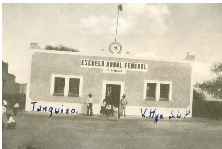
FIGURA 9 - ESCUELA RURAL FEDERAL “VENUSTIANO CARRANZA”, “EL TANQUITO”, MUNICIPIO DE VILLA HIDALGO, S.L.P

El edificio escolar ocupaba un local formado por dos o tres amplios salones, cuyas dimensiones variaban de entre 10 metros de largo, 5 metros de ancho y hasta 3 metros de alto (AHSEP. DFE. Año 1933, caja 107, exp. 39, folio 99) a 8 metros de largo, 5 metros de ancho y 3 metros de alto. En realidad no existía un criterio para la construcción de los edificios escolares, sólo se designaba que debería ser un local propio para la escuela. En promedio, durante la posrevolución, cada escuela rural atendía a 73 alumnos en cada ranchería. La construcción escolar contaba con el teatro al aire libre, el campo deportivo, el huerto escolar, el jardín, los anexos como el gallinero, excusado de letrina, la parcela escolar, el apiario, la casa del maestro, que se empezó a extender a partir de la década de 1930.