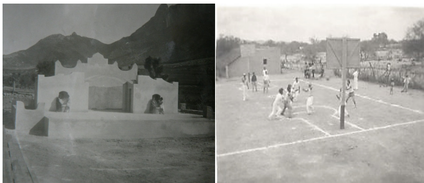
FIGURA 6 - TEATRO AL AIRE LIBRE, ESCUELA NORMAL RURAL DE GALEANA, 1932 / CANCHA DE BÁSQUETBOL “EL CHARQUILLO”, DR. ARROYO, N.L., 1932

Los teatros al aire libre, las canchas deportivas y los baños fueron también espacios indispensables en las escuelas rurales, pues los dos primeros servían para cumplir los objetivos de la escuela rural de fomentar y difundir la cultura nacional y la moralización campesina a través de obras de teatro y ceremonias cívicas, que como escenario contaron con el teatro al Aire Libre. Asimismo, el deporte se vio como una práctica fundamental para fomentar la salud, la convivencia, el trabajo en equipo, la diversión “sana” que alejara a los jóvenes y adultos de “los vicios”. Ambas construcciones fueron muy sencillas, los teatros consistían en estrados de material de concreto con escaleras a sus costados, en el fondo se levantaba una barda de ladrillo que era enjarrada y decorada con murales que hacía alusión a la vida campesina y al progreso material. Las canchas deportivas eran las más simples de hacer, pues se desmontaba un terreno, se delimitaba con cal sus extensiones y se colocaba una red en medio para hacer una cancha de voleibol o bien se colocaban en sus extremos dos canastas fabricadas de madera para convertirla en cancha de básquetbol.