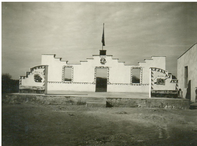
FIGURA 10 - TEATRO AL AIRE LIBRE, ESCUELA FEDERAL SOCIALISTA "AMADO CEDILLO", 1934, EL GRANGENAL, VILLA JUÁREZ

El edificio que se inauguraba era un amplio salón de más de 100 metros cuadrados; la casa del maestro estaba compuesta por sala, recámara, comedor y cocina. El teatro al aire libre tenía un mural al fondo y el campo deportivo tenía las medidas reglamentarias de una cancha de básquetbol.