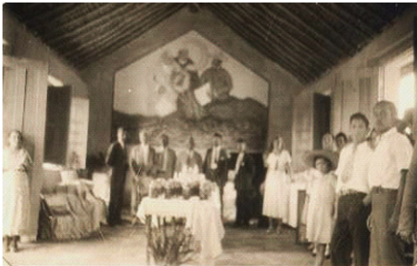
FIGURA 5 - INTERIOR DEL SALÓN DE CLASE DE LA ESCUELA DE RANCHO ESCONDIDO, MONTEMORELOS, 1932

pintada de color negro y sobre la que se escribía con gises de yeso. En las escuelas que estaban “aplanadas” se dibujaban en sus paredes algunos murales de los héroes patrios o bien elementos del nacionalismo mexicano, imitando a los muralistas mexicanos como Orozco, Rivera y Siqueiros, se representaba a campesinos labrando la tierra, la hoz, el arado, el maíz y las torres de petróleo.