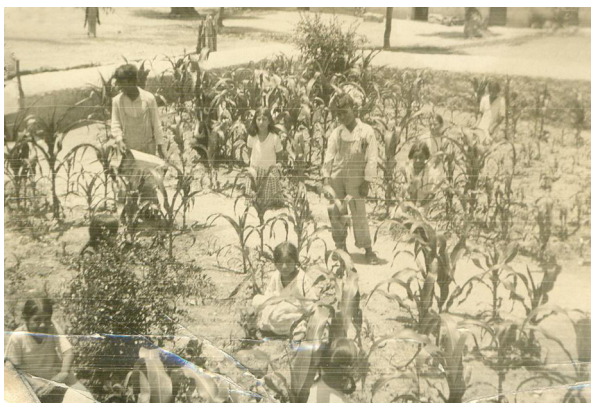
FIGURA 11 - HUERTO DE LA ESCUELA

La introducción de nuevos cultivos tuvo como fin diversificar la agricultura en las comunidades rurales que practicaron el monocultivo de maíz o frijol se fomentó el autoconsumo mediante los huertos escolares, así los campesinos conocieran nuevas especies agrícolas o las incorporaron a sus prácticas agrícolas. El espacio más inmediato para la siembra fue el huerto escolar, donde se cultivaron hortalizas, flores, frutas, cereales y forraje como la alfalfa. En 1933 el Inspector Aurelio C. Merino, en su Informe relativo a las actividades y acciones realizadas en la 5ta. Zona escolar del estado resumía el éxito de la política educativa en las escuelas rurales de la siguiente manera: “Este importante servicio social encomendado por la Secretaría a las escuelas rurales [...] se nota fácilmente la transformación que mediante la acción de la escuela” 22 . La acción directa de la escuela rural y sus agentes estaban logrando transformar la vida rural tal como el proyecto educativo posrevolucionario lo había definido.