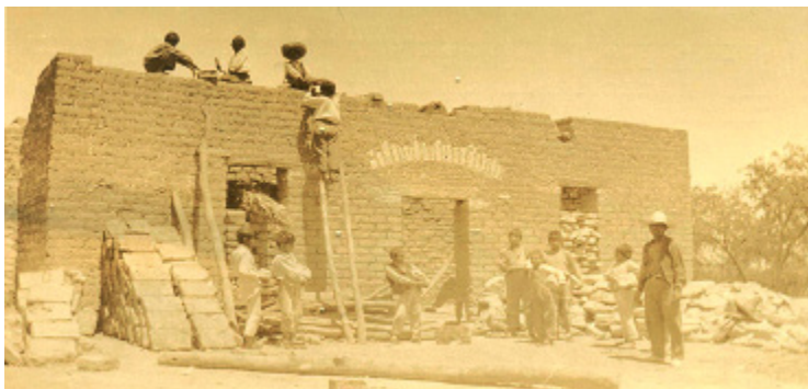
FIGURA 8 - LOS ALUMNOS DE “EL SALERO”, MUNICIPIO DE VENADO, EDIFICANDO SU CASA-ESCUELA, MARZO DE 1926

Fue durante este periodo cuando se delineó que, además de la labor educativa en el aula desempeñada por el maestro, prescrita en el Plan mínimo que observarían las escuelas rurales 12 también debían realizar un conjunto de acciones encaminadas a mejorar la vida material de las comunidades campesinas como: floricultura, horticultura, agricultura, practicada en el jardín, el huerto y la parcela escolar; cría de aves de corral, palomares y cunicultura, porcicultura, en los anexos construidos por tal efecto; organización de cooperativas de consumo entre los alumnos y los vecinos; formación de comités para campañas de higiene, antialcohólicas, en contra de los vicios y de los juegos de azar; introducción de prácticas deportivas como el voleibol y el básquetbol; conmemoración de fechas cívicas con programas escolares, donde se ponía de relevancia el origen de la mexicanidad, mediante poesías, cantos y bailables folclóricos 13 ; pero sin duda de entre todas las que destacó fue la construcción de las escuelas, lo anterior vino a constituir lo que los intelectuales y la clase dirigente llamaron la “acción federal” de la escuela rural.