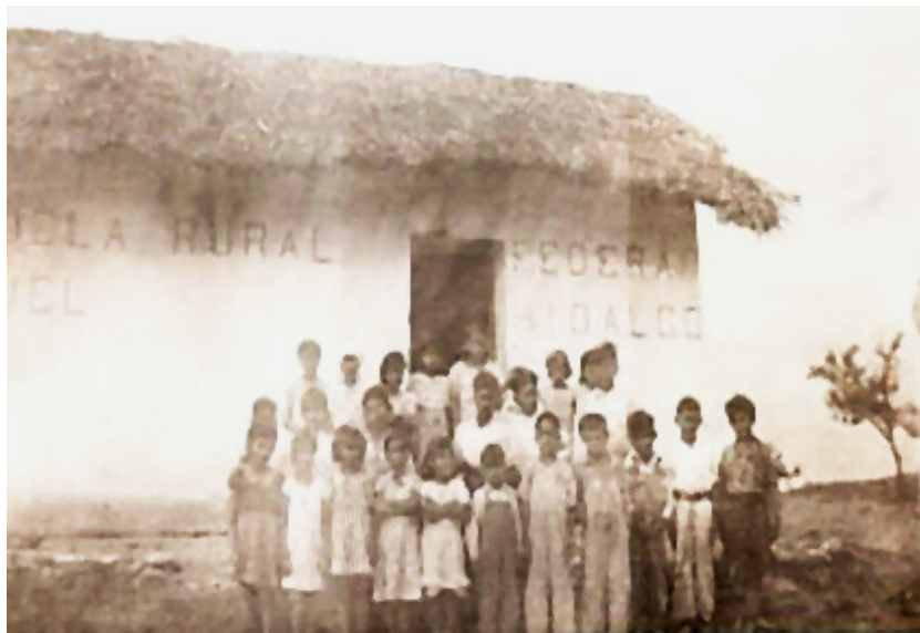
FIGURA 3 - ESCUELA DE SAN MIGUEL, MONTEMORELOS, NL, 1940

y kermeses para recaudar fondos para la escuela, tal fue el caso de la directora de la escuela rural de “Los Cavazos” en Santiago, N.L. que, según el inspector, señaló “[...] con el producto de una fiesta escolar la Directora, realizó las siguientes mejoras materiales: arreglo de piso del salón de clases, aplanamiento y pintura de las paredes interiores, gastándose en todo esto la suma de $52.60” o bien, se fundaban cooperativas de alumnos y padres de familia que conseguían recursos con las autoridades políticas 10 .