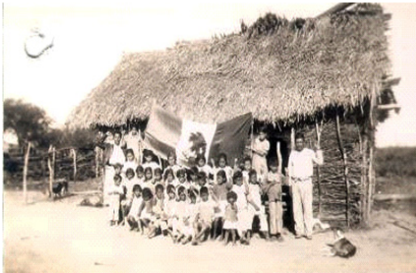
FIGURA 2 - ESCUELA DE “LA UNIÓN”, MONTEMORELOS, 1939

la situación precaria de la escuela (AHSEP. Caja 5481, N. 2780). A este tipo de infraestructura la denominaban “jacales miserables” que medían alrededor de 5 por 7 metros cuadrados, con una asistencia promedio de 35 alumnos. Algunos maestros se quejaban del hacinamiento de los niños en estos establecimientos.