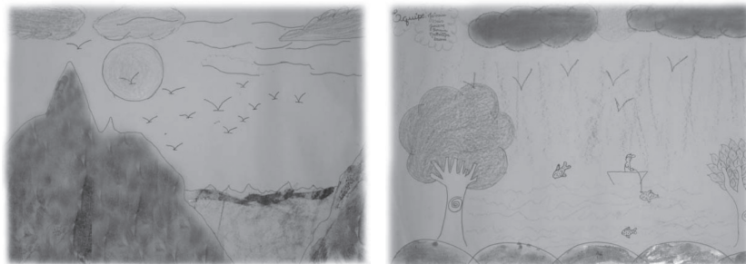
FIGURA 4 – PRODUÇÃO DA OFICINA PEDAGÓGICA

Cartazes produzidos pelas crianças na oficina pedagógica, após a execução da peça: o ciclo da água.