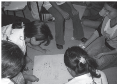
Oficina pedagógica após a execução da peça: ciclo da água. Crianças produzindo cartazes.