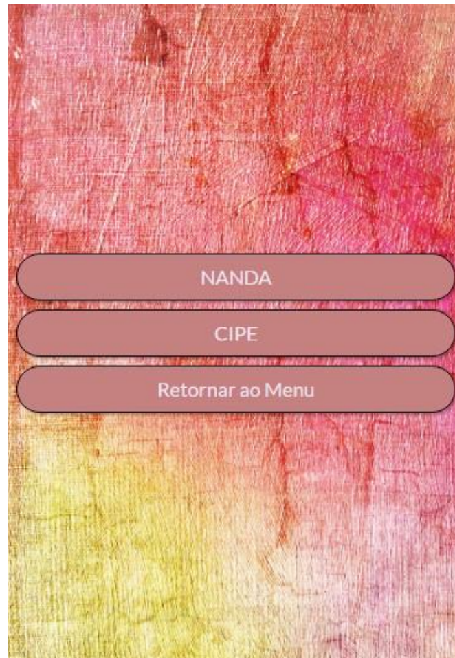
Figura 3 - Menu dos diagnósticos de enfermagem. Florianópolis, Santa Catarina, Brasil, 2017

Após a etapa de avaliação do aplicativo, foram realizadas algumas melhorias, destacando-se: Troca de alguns segmentos de texto por figuras, imagens e gráficos, facilitando a visualização e o entendimento rápido do conteúdo; Melhoramento no design do aplicativo; Inclusão dos diagnósticos de enfermagem CIPE® e NANDA® ( North American Nursing Diagnosis Association ) com menu, possibilitando a alternância entre eles, de modo que outros contextos de trabalho dos enfermeiros, inclusive em outras unidades hospitalares, pudessem fazer uso do aplicativo; Adição de menus secundários individuais (alterações clínicas, diagnósticos de enfermagem e vídeos), nos quais o usuário pode selecionar, dentro do menu de alterações clínicas, aquelas que lhe interessar naquele momento, ou, então, ao entrar no menu de vídeos, clicar naquele de interesse e o mesmo abrir em um programa específico de vídeos; Acesso aos artigos, periódicos e estudos usados no aplicativo no menu principal (Figura 3 e 4).