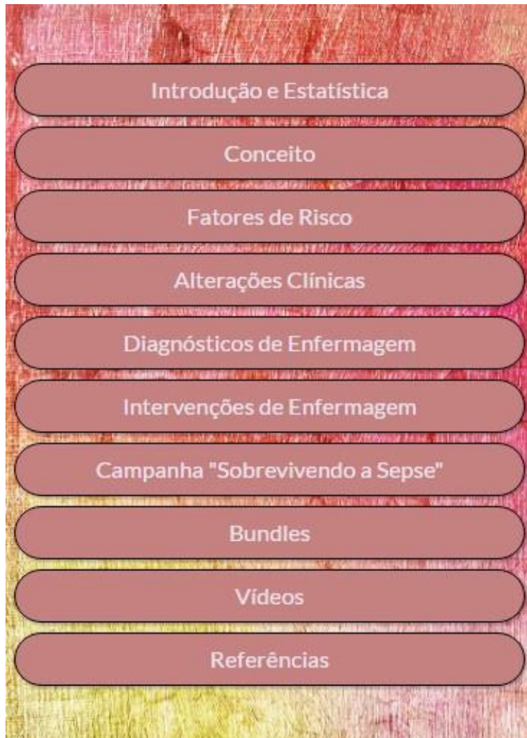
Figura 2 - Menu principal. Florianópolis, Santa Catarina, Brasil, 2017

A seguir, apresentam-se as duas categorias elaboradas: Avaliação do conteúdo do aplicativo e Aprimoramento do conteúdo do aplicativo.