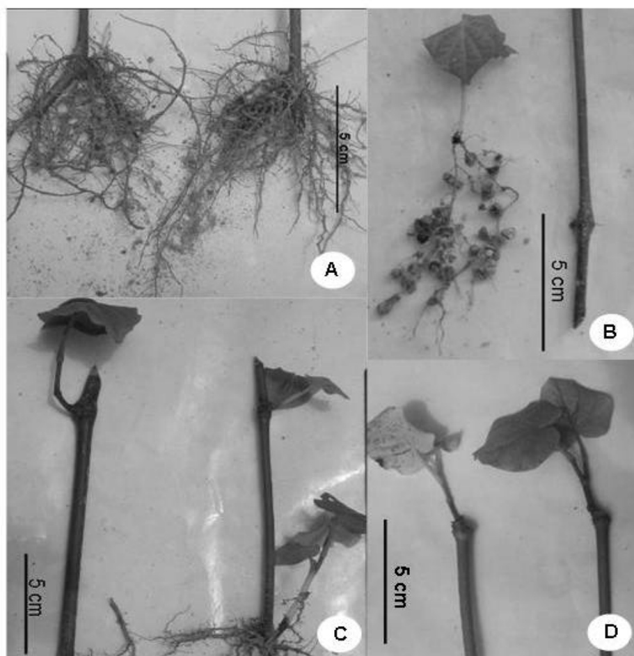
FIGURA 2 - Aspecto geral das estacas de Piper mikanianum , sendo: (A) desenvolvimento das raízes em substrato constituído por areia e (B) em substrato constituído por vermiculita; (C) aspectos das brotações em substrato constituído por areia e (D) em substrato constituído por vermiculita.

O efeito benéfico da aplicação de AIB foi verificado em estacas de ameixeira ( Prunus salicina ) por TONIETTO et al. (2001). Estacas da cultivar Pluma 7 apresentou um aumento significativo no número de raízes por estaca, passando de 1,6 na ausência de tratamento por reguladores de crescimento para 4,2 raízes em estacas tratadas com 2000 mg L -1 de AIB, sendo seu percentual de enraizamento de 99% (TONIETTO et al., 2001).