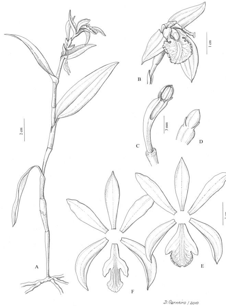
Fig. 1. Psilochilus ssp. A, hábito; B, flor de Psilochilus modestus Barb. Rodr.; C, coluna em vista ventral; D, coluna em vista dorsal; E, flor dissecada de P. modestus ; F, Flor dissecada de Psilochilus dusenianus Kraenzl. Ex Garay & Dunst. (Desenho de Diana Carneiro).