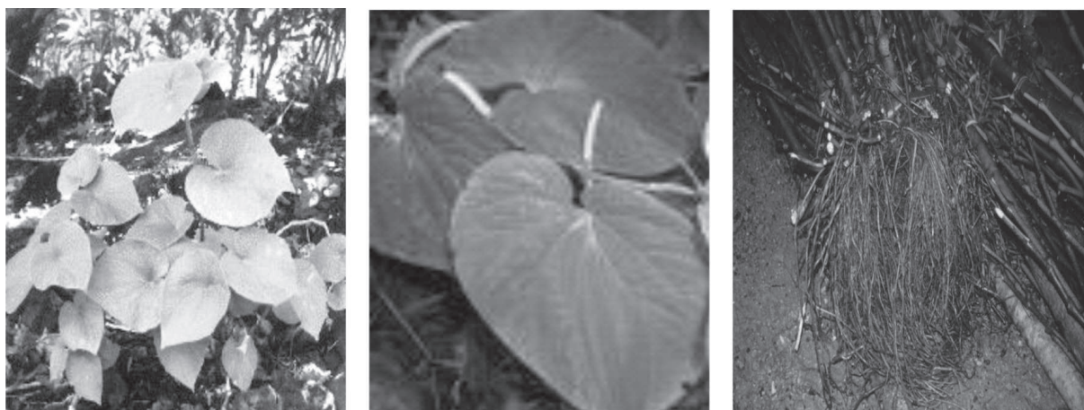
Figura 1: Aspectos da Kava. A – Aspecto geral; B – Detalhe das folhas; C – Rizoma.