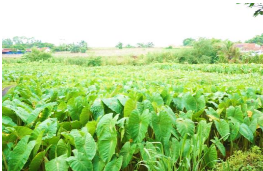
Gambar 3 Sistem budi daya monokultur talas

ditanam dalam dua baris di bedengan selebar 1,2 m. Bibit talas ditanam tegak lurus di tengah-tengah lubang kemudian ditimbun sedikit dengan tanah (Gambar 4). Penimbunan kira-kira 7 cm sehingga lubang tanam tidak seluruhnya tertutup oleh tanah