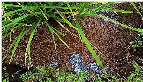
Gambar 10 Pencemaran limbah kimia di lahan petani

Selain itu saat dilakukan observasi, ditemukan pencemaran tanah pada lahan sawah petani (Gambar 10). Pencemaran ini berupa limbah kimia yang mengalir bersama irigasi yang bersumber dari sungai di atas lahan persawahan milik petani.