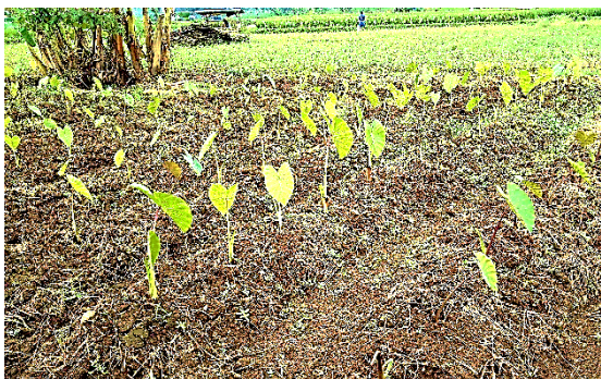
Gambar 4 Penanaman bibit talas

Penanaman di lahan sawah cenderung menggunakan jarak tanam yang lebih rapat saat musim hujan. Pada saat musim panas penyinaran cahaya matahari dapat berlangsung sepanjang hari sehingga dengan jarak tanam yang rapat pun kelembaban udara di sekitar tanaman tetap optimum. Jika pada musim hujan digunakan jarak tanam yang rapat maka tanaman akan kurang menyerap sinar matahari dan kelembaban di sekitar tanaman menjadi tinggi. Hal ini akan meningkatkan risiko serangan penyakit. Penanaman talas sebaiknya dilakukan pada awal musim hujan apabila curah hujan merata sepanjang tahun.