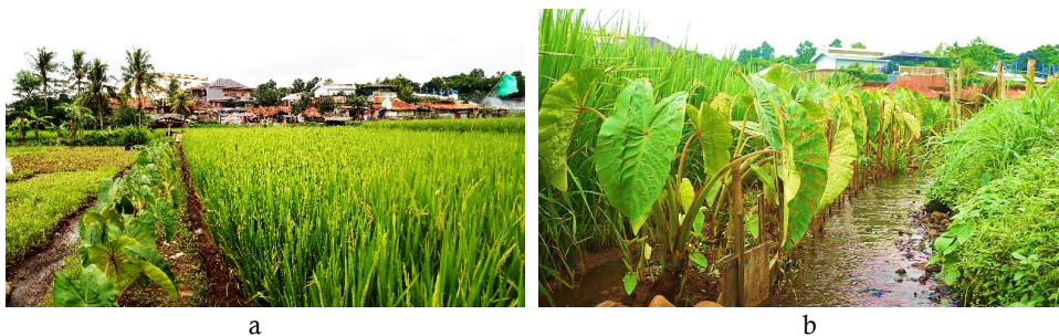
Gambar 7 a) Sistem budi daya polikultur padi-talas dan b) Sistem irigasi pada polikultur padi-talas

Selain dilakukan sistem tumpang sari dengan tanaman jagung, petani di RW 6 Kelurahan Bubulak juga menggabungkan pola tanam talas dengan komoditas utama padi. Pada sistem polikultur dengan padi, tanaman talas ditanam pada pematang sawah (tepi sawah) (Gambar 7a). Pada pola pertanaman ini pemeliharaan seperti pemupukan, pembumbunan, dan irigasi memiliki sistem yang berbeda. Tanah pada area pematang sawah tempat tumbuh talas harus selalu ditinggikan serta dibuat saluran irigasi pada samping dalam dan luar pematang sawah (Gambar 7b). Produksi yang dihasilkan rendah karena populasi tanaman talas untuk pematang sawah dalam satu hektar sedikit jumlahnya.