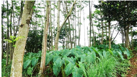
Gambar 8 Sistem budi daya agroforestri sengan-talas

Sistem budi daya polikultur talas secara agroforestri juga telah diterapkan di Kelurahan Bubulak. Agroforestri sedehana ini menggunakan tegakkan tanaman sengan ( Albizia chinensis ) sebagai tanaman utama dan talas yang ditanam di sela – sela tegakkan sengan (Gambar 8). Sistem agroforestri bertujuan mengoptimalkan penggunaan lahan dengan mengkombinasikan tanaman perkebunan dengan pertanaman pertanian untuk peningkatan produktivitas lahan. Menurut Sudomo (2014), pertumbuhan pohon dan tanaman pertanian dalam agroforestrikan saling berinteraksi secara positif, netral, atau negatif. Hal ini diakibatkan oleh keterbatasan daya dukung lahan dalam menyediakan faktor-faktor pertumbuhan bagi dua atau lebih tanaman penyusun, yaitu sinar matahari, unsur hara/ nutrisi, dan air.