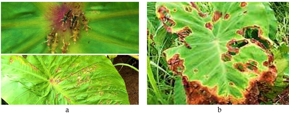
Gambar 9 a) Hama pada tanaman talas dan b) Penyakit pada tanaman talas

itu terdapat beberapa penyakit yang menyerang tanaman talas yaitu hawar daun (Gambar 9b) yang disebabkan oleh bakteri Phytophthora colocasiae yang menyebabkan tanaman terdapat bercak kecil berwarna kehitaman, kemudian akan meluas menjadi hawar. Penyakit ini ditemukan di sistem budi daya monokultur hal ini dikarenakan adanya rotasi tanaman yang dapat memutus siklus hidup hama dan patogen. Sistem budi daya polikultur memiliki beberapa kelebihan diantaranya dapat mengurangi serangan OPT karena adanya heterogenitas tanaman dalam satu sistem budi daya. Menurut Warsiyah (2013) pada sistem budi daya secara polikultur, siklus hidup hama atau penyakit dapat terputus karena adanya rotasi tanaman yang dapat memutus siklus hidup hama dan penyakit. Selain hama dan penyakit, gulma juga merupakan tumbuhan lain yang mengganggu tanaman budi daya. Gulma yang paling banyak ditemukan adalah rumput-rumputan, dan banyak terdapat di sistem budi daya polikultur.