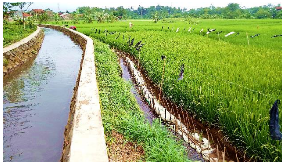
Gambar 2 Sungai Cibende sebagai sumber air utama untuk irigasi pertanian di Kelurahan Bubulak

Kelurahan Bubulak memiliki luas sekitar 157.085 ha dengan luas 47,2 ha dijadikan sebagai perumahan dan 68.265 ha digunakan sebagai lahan pertanian di sektor tanaman pangan seperti padi dan talas. Kelurahan Bubulak memiliki beberapa sektor yang menjadi penopang ekonomi desa, salah satu diantaranya adalah pertanian. Kelurahan Bubulak berada di dataran rendah dengan ketinggian 160 meter dari permukaan laut. Suhu rata-rata wilayah Bubulak rata-rata 26°C setiap bulannya dengan kelembaban udara kurang lebih 90% dan curah hujan rata-rata antara 3,500-4,000 mm/tahun. Kelurahan Bubulak dialiri Sungai Cibende yang merupakan sumber air utama sebagai irigasi lahan petani (Gambar 2).