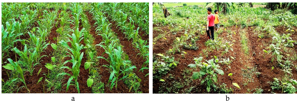
Gambar 6 a) Sistem budi daya polikultur jagung-talas dan b) Sistem budi daya polikultur terung-talas

kedua sistem tumpang sari talas ini berupa pembumbunan dan pemupukan pada sistem budi daya ini yaitu sama dengan pemeliharaan monokultur jagung. Sistem irigasi yang digunakan tidak terlalu khusus, hanya dibuat parit di tepi-tepi lahan untuk drainase.