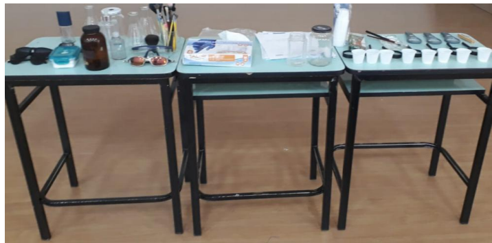
Figura 3: Bancada com os kits de investigação.

O uso de bonecos justifica-se de modo a evitar qualquer estereótipo ou identificação negativa por parte dos alunos.