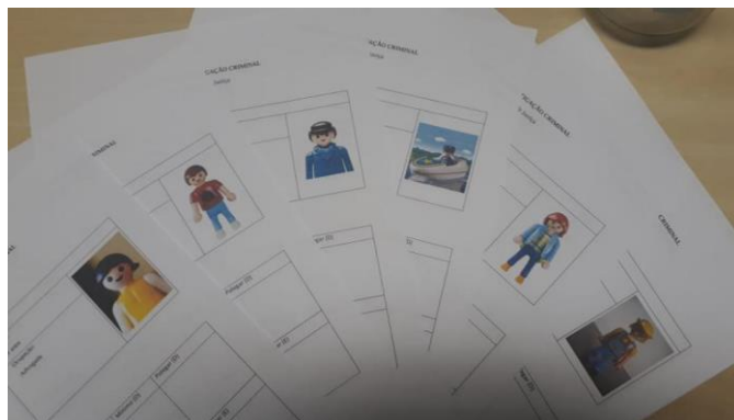
Figura 2: Fichas dos suspeitos

O uso de bonecos justifica-se de modo a evitar qualquer estereótipo ou identificação negativa por parte dos alunos.