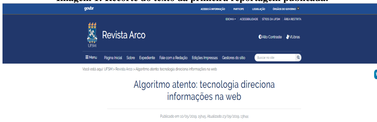
Imagem 1: Recorte do texto da primeira reportagem publicada.

Disponível no site da UFSM, no menu Revista Arco. Link disponível no rodapé.