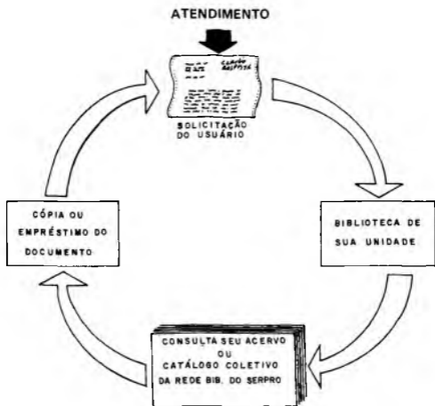
Figura 3. Fluxo de atendimento.