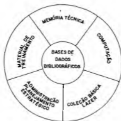
Figura 4. bases de dados bibliográficos.