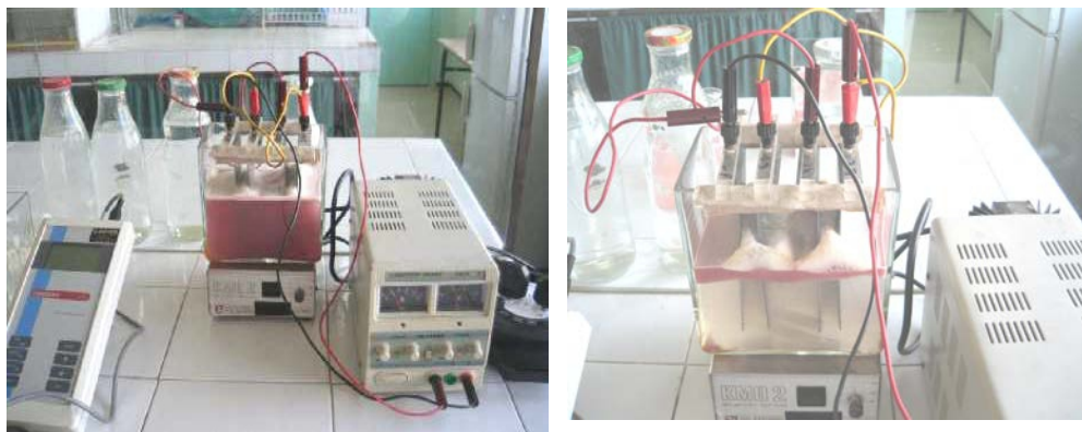
Figure 1: Montage d'électrocoagulation, (a) début de traitement, (b) fin de traitement

Le test d'électrocoagulation est fait par des essais avec des électrodes d'aluminium et de fer dans une cellule électrolytique en verre de capacité 21,75 dm 3 . Le courant est généré par un générateur LW labor GMBH à alimentation variable allant de 1 à 30 volts. Les échantillons utilisés sont de 1 litre, et de même DCO (2600 mg/L) que ceux traités par coagulation-floculation. La connexion est de mode monopolaire parallèle (Prétorius et al. , 1991). Les électrodes sont des plaques lamellaires de fer et d'aluminium placées de façon parallèle espacé de 2 cm. La surface active des électrodes est de 80 cm 2 , la densité de courant varie, en fonction de la tension aux bornes, entre 15 et 52,5 mA /cm 2 .