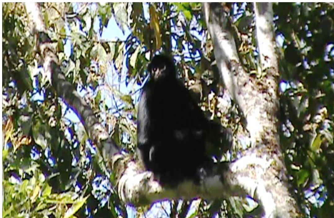
Figura 3. Individuo adulto de Ateles chamek observado en bosque montano de Pampamarca, sector Alto Huallaga