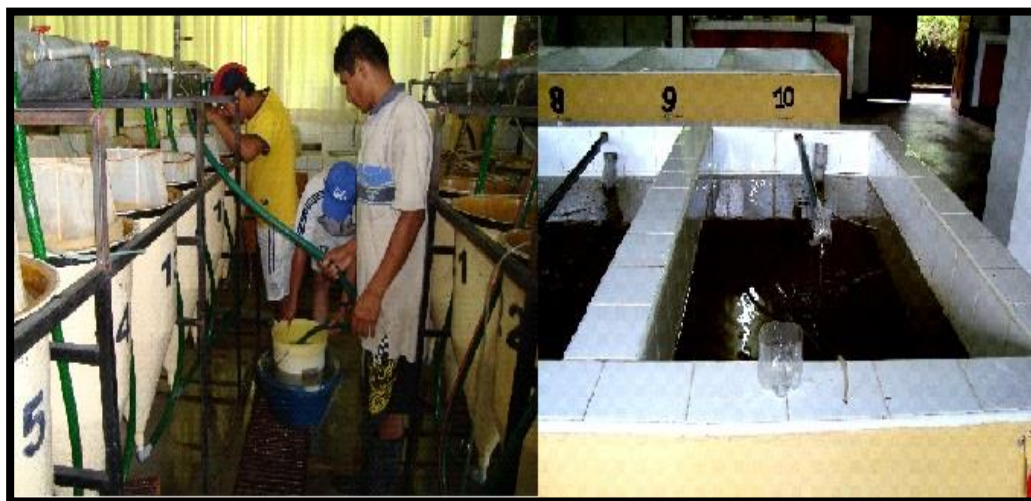
Figura 3. Cosecha y cría de larvas en el C. I. Quistococha -IIAP

Las larvas cosechadas fueron criadas bajo techo en tanques de un metro cúbico con suministro de agua en flujo continuo y aireación permanente. En esta fase fue realizada la alimentación de larvas con alimento vivo producido en un módulo especialmente habilitado (Figura 3).