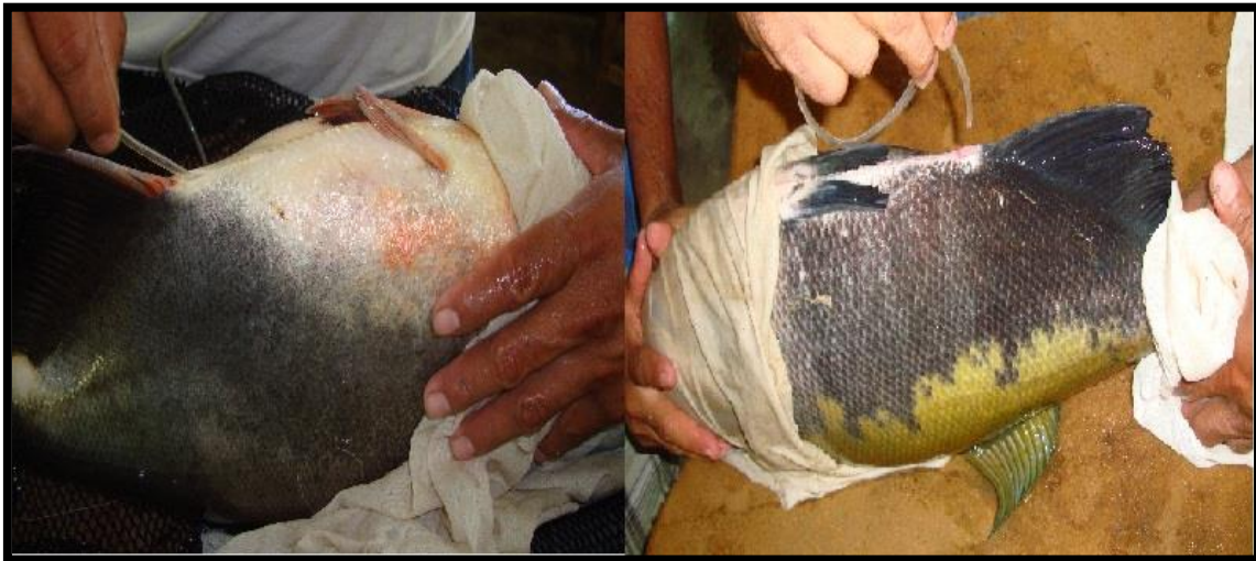
Figuras 1. Endoscopía ovárica en hembras de paco y gamitana para la obtención de óvulos

En este sentido, fueron seleccionadas las hembras que presentaron óvulos con dos categorías de tamaño, correspondientes a los óvulos maduros (los de mayor tamaño) y los de reserva (los más pequeños) (Figura 2), reservando los peces que presentaron más de dos categorías de tamaño de óvulos para que continúen su maduración. Este procedimiento es concordante con el protocolo reportado por Alcántara et al. (2010 a).