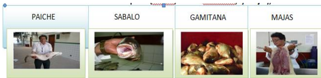
Figura 2: Determinación de Especies de Pescado (Paiche, Sábalo y Gamitana) y la Carne de Majas