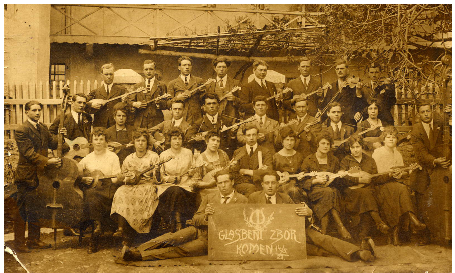
Tamburaški zbor iz Komna, 1922.