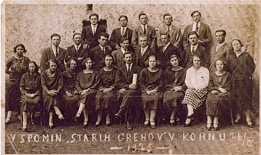
Igralci igre Stari grehi.

sledi lahko očiščenje, po katerem tako neizrecno hrepeni duša plemenitega človeka». Na koncu še dodaja, da je »marsikdo lahko črpal nekaj snovi iz te veseloigre za svoje življenje, kako naj določa njega smer, da bo zrl v svoji starosti z zadoščenjem in ponosom na svoje mladostne dni«. V članku je pisec tudi podal kritiko, da je bilo »opaziti na par mestih, da so imeli igralci premalo vaje in da je bilo »mestoma, posebno v začetku motenje prisotnih otrok tako veliko, da je to vznemirjalo, ne samo gledalce, temveč tudi igralce«, zato svari starše, »otroci naj se pripuste ob takih prilikah le v omejenem številu in na gotova mesta« (Edinost, 23. april 1925, št. 95). Veseloigra Stari grehi je povsod požela veliko uspeha, tako na amaterskih kakor tudi na poklicnih odrih. Ob tej priliki se je predstavil tudi pevski zbor, ki je med drugimi točkami zapel venček slovenskih narodnih pesmi, medtem ko je povabljeni komenski tamburaški zbor oziroma orkester zatajil. Ker je bila prireditev zelo odmevna, je sledila ponovitev v poletnem času.