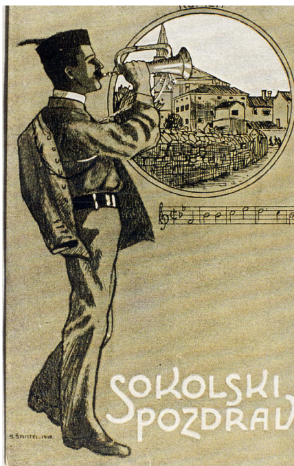
Razglednica komenskega sokolskega društva, 1910

Prvi javni nastop po prvi svetovni vojni je priredilo Telovadno društvo Sokol 21. junija 1914. Pripravili so spored s prikazom telovadnih vaj, nakar je sledil ples. Zabava se je odvijala na igrišču za telovadbo, t. i. telovadišču , ki se je nahajalo ob gozdičku v Cirju. 7 Pred prvim telovadnim javnim nastopom so prirejali tudi veselice, navadno v društveni dvorani župana Žigona 8 ( Soča ,