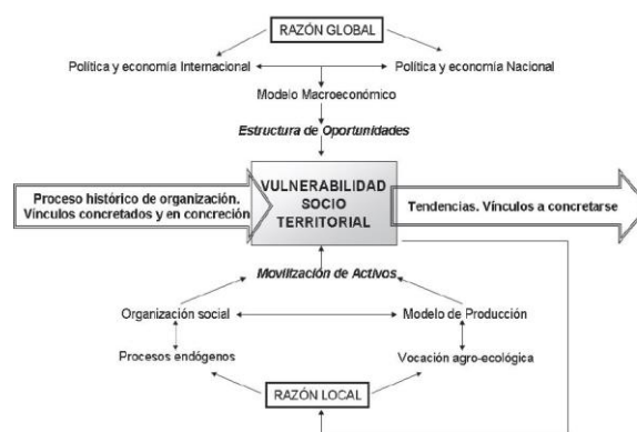
Figura 1. Vulnerabilidad socio-territorial. Relación entre vulnerabilidad y territorio.

El esquema tiene la intención de visibilizar la complejidad de leer un contexto social y las posibilidades que desde el enfoque de vulnerabilidad socio – territorial se presentan al entrelazar condicionamientos y particularidades macro que son puestas y vividas en procesos sociales que se gestan en lo local. Desde este enfoque además, pueden ser analizados los mecanismos de producción de riesgo, desde factores inmateriales que contribuyen la vulnerabilidad, que no son fácilmente visibles y por lo tanto, menos estudiados y atendidos; además, son elementos constitutivos del habitar y del territorio. En la figura 1, se grafican dichas relaciones: