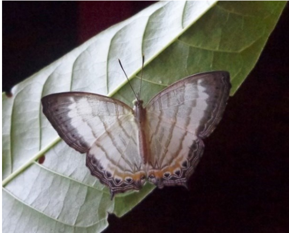
Gambar 4. Imago kupu-kupu Cyrestis themire .

hari. Pengetahuan akan perkembangan masa sebelum imago bisa menjadi bahan kajian taksonomi sedangkan pengetahuan akan tumbuhan yang dijadikan tumbuhan inang bisa membantu upaya pelestarian spesies tersebut.