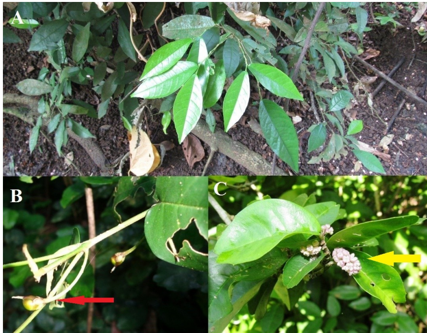
Gambar 1. (A) bentuk daun Streblus ilicifolius ; (B) bunga jantan (panah merah); (C) bunga betina (panah kuning).