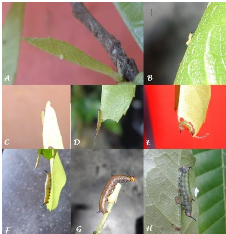
Gambar 2. Perubahan morfologi Cyrestis themire dimulai dari tahap telur. (A) instar 1; (B) dan (C) instar 2; (D) instar 3; (E) instar 4; (F) instar 5; (G) dan (H) prapupasi.