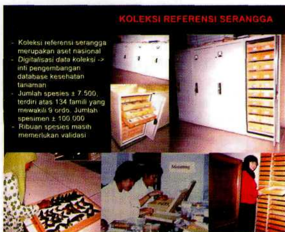
Gambar 2. Koleksi serangga di Balai Besar Penelitian dan Pengembangan Bioteknologi dan Sumberdaya Genetik Pertanian

Dengan sangat langkanya tenaga taksonomis dan kurangnya minat SDM dalam menekuni riset biotaksonomi, maka informasi keragaman jenis-jenis OPT yang sah, persebaran, kisaran inang atau informasi lain tidak mudah diakses dengan cepat. Kendala itu dapat merupakan hambatan dalam memenuhi kesepakatan WTO-SPS. Banyak koleksi serangga yang tersimpan di berbagai institusi termasuk koleksi serangga di Balai Besar Bioteknologi dan Sumberdaya Genetik Pertanian masih belum memenuhi persyaratan standar internasional karena masih