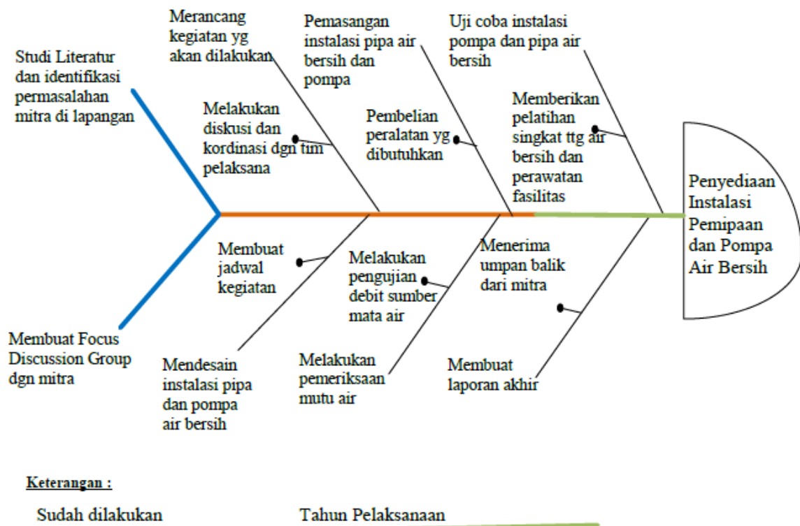
Gambar 2.1. Diagram fishbone

Untuk mempermudah kegiatan yang dilakukan maka digunakan diagram fishbone sehingga kegiatan akan terarah dan sistematis.