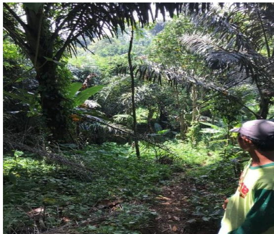
Gambar 3.1. Foto lokasi sumber mata air

Setelah desain instalasi pemipaan dan pompa untuk mengalirkan air bersih dari sumber mata air ke toren air di lingkungan pesantren selesai dibuat, maka selanjutnya adalah memulai pekerjaan berupa penyediaan bahan-bahan yang diperlukan kemudian melakukan pekerjaan pemasangan pipa air dan pompa. Sangat dibutuhkan sekali kejelian dalam memilih jenis dan kapasitas pompa air yang digunakan karena lokasi sumber air berada jauh dilembah bukit dengan jarak 120 meter dan perbedaan elevasi dengan toren air sekitar 30 meter. Untuk mengatasi hal tersebut, setelah memperhitungkan aspek teknis dan berbagai hal maka diambil langkah dengan menggunakan 2 buah pompa, 1 unit dengan jenis jetpump dan yang satunya dari jenis pompa sentrifugal biasa. Berikut ini dapat dilihat foto-foto dokumentasi pekerjaan dan kegiatan pengabdian pada masyarakat.