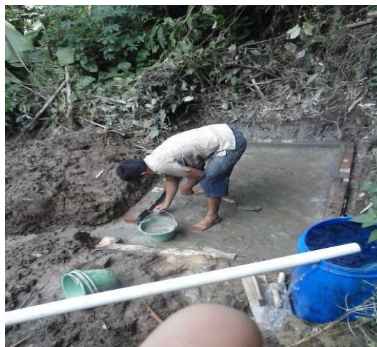
Gambar 3.3. Pembuatan pondasi dan pemasangan tangki penampungan