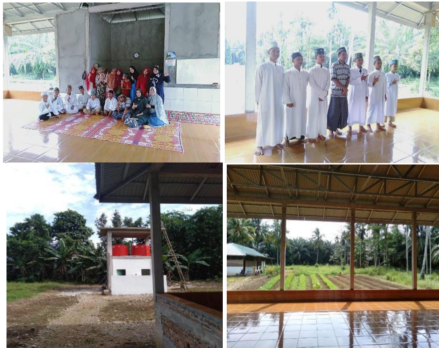
Gambar 1.1. Pondok Tahfidz Quran Al Fitrah di Namo Rambe

Pada usulan program pengabdian pada masyarakat USU tahun 2019 ini direncanakan untuk memberikan bantuan kepada Pondok Tahfidz Quran Al Fitrah yang sangat membutuhkan unit penyaringan air baku menjadi air minum. Untuk itu tim pengabdian akan melakukan kerjasama untuk menjadikan pondok tahfidz tersebut menjadi mitra pengabdian. Pesantren ini telah berdiri sejak tahun 2017 dan memiliki kurang lebih 56 orang santri penghawal Quran. Tim pengabdian USU akan berusaha mencari solusi penyelesaian agar pesantren ini dapat memanfaatkan sebuah sumber mata air agar airnya dapat langsung diminum tanpa harus merebusnya.