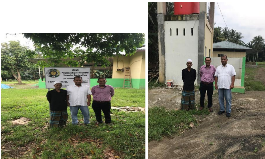
Gambar 3.6. Foto tim pengabdian beserta tim monitoring & evaluasi dan pengurus pesantren.

Setelah dilakukan pemasangan instalasi pemipaan dan pompa air bersih beserta perlengkapannya maka dilakukan penyuluhan singkat dan padat tentang penggunaan dan perawatan peralatan seperti tersebut di atas. Hal ini dilakukan agar sistem perawatan terhadap fasilitas tersebut dapat maksimal sehingga usia pakai peralatan dapat menjadi lebih lama.