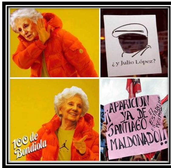
Fig. 2 Meme de 100 de Bondiola 31