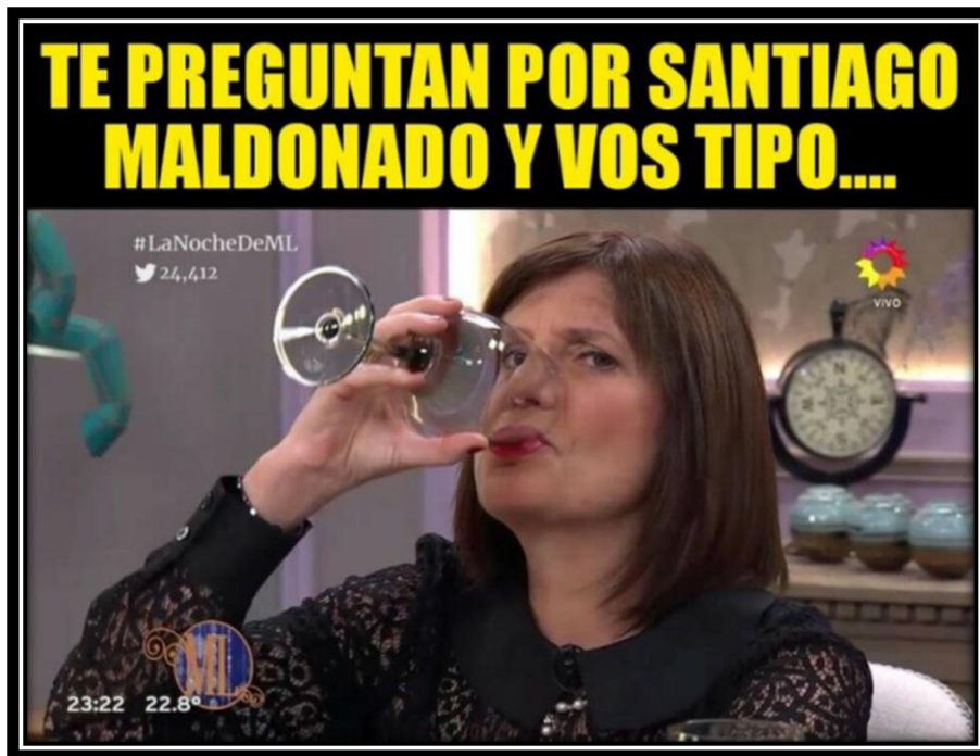
Fig. 5 Meme de Hay que dejar de robar con Pigna por dos años 34

No obstante, esta coincidencia no implica que la propuesta risible sea idéntica. Dado que lo que define lo risible es lo enunciativo 35 , el emplazamiento en las páginas kirchneristas presentó una propuesta cómica porque el enunciador y el enunciatario no se identificaban con el gobierno. En las páginas antikirchneristas, en cambio, sobre lo cómico se encabalgó una enunciación cínica que tomaba distancia de la funcionaria aun cuando, la mayoría de sus memes, apoyaban sus declaraciones. Por lo tanto, este meme sobre ella se enmarcaba en una licencia abierta a una lectura cómica condescendiente. Podemos advertir, entonces, que la sedimentación de discursos generados en cada sistema operó como condición de producción y reconocimiento. Ahora nos ocuparemos de esa producción que hizo a