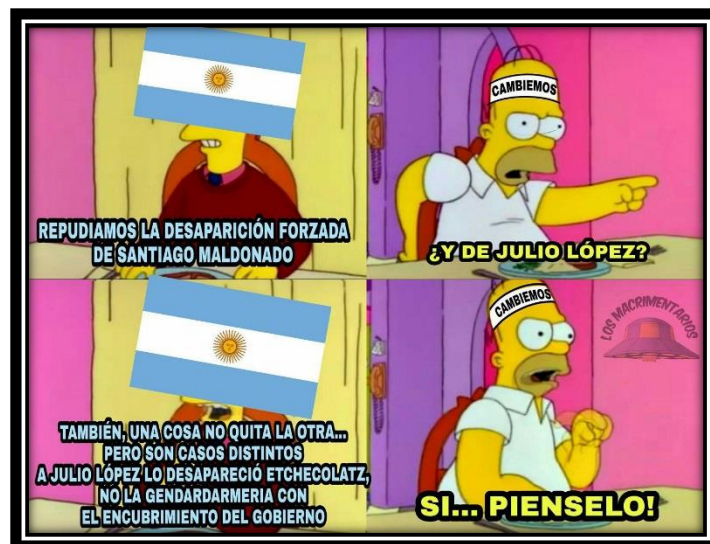
Fig. 3 Meme de Macrimentarios 32

Estas interpenetraciones entre sistemas de cuentas no sólo se materializaron en el espacio de exposición de memes sino también en el de los comentarios, donde «infiltrados» respondían con memes generados en los colectivos contrarios.