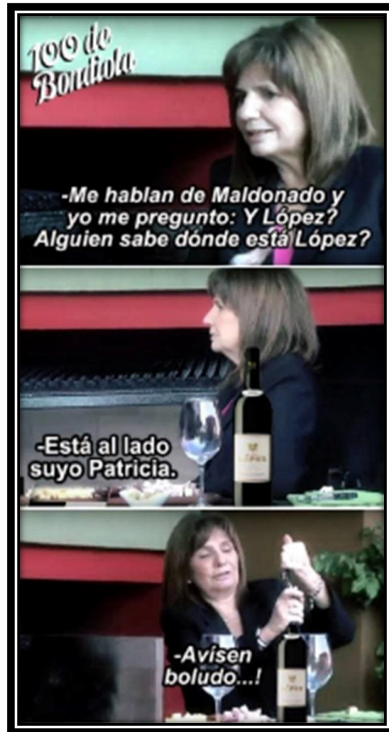
Fig. 4 Meme de 100 de Bondiola 33

Otro caso de interpenetración fue el ingreso a los sistemas de cuentas kirchneristas y antikirchneristas de motivos que tuvieron un tratamiento equivalente en la superficie discursiva. Un ejemplo, fue la figuración risible de Patricia Bullrich, ministra de seguridad de la nación, como borracha, tal como se muestra abajo.