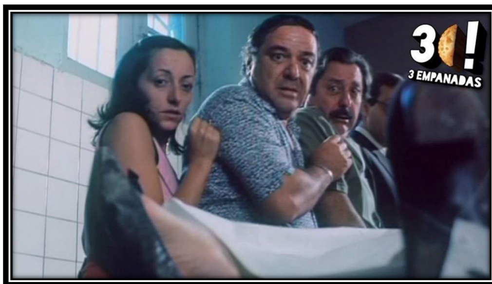
Fig. 8 Meme de 3 empanadas 42

En el primer meme se desplaza el nombre de Santiago Maldonado a Santiago Bal, comediante picaresco, para hacer un remate propio de ese género y, en el segundo, se compara el reconocimiento del cuerpo realizado por la familia de Maldonado con la misma acción en la clásica comedia Esperando la carroza (1985). Ambos casos ilustran el modo habitual que suele construir su blanco lo cómico negro antikirchnerista cuando recae en Maldonado. Por un lado, puede limitarse a Maldonado o su familia, como es el segundo caso, pero también puede sumar un blanco que entra en diálogo con los discursos que consideran opositores. El primer meme al mismo tiempo que se burla de la desaparición, lo hace de la campaña que en aquel momento se propagó en las redes presionando al gobierno para que apareciera con vida Maldonado.