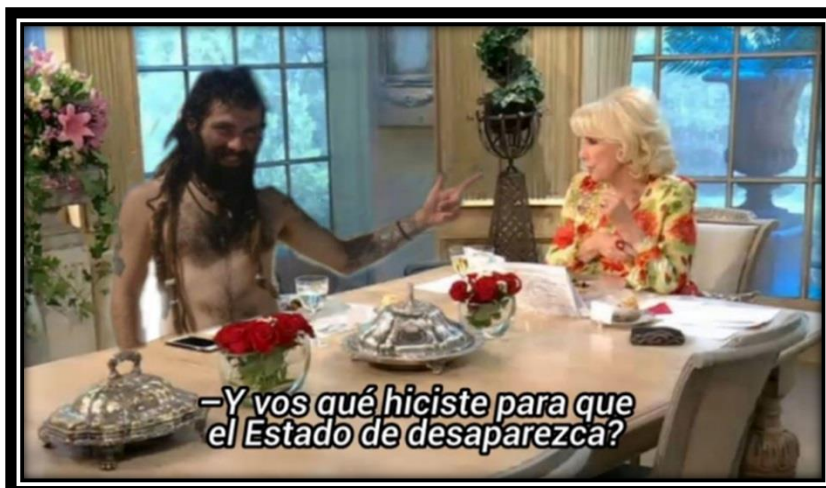
Fig. 10 Meme de Hay que dejar de robar con Pigna dos años II 46