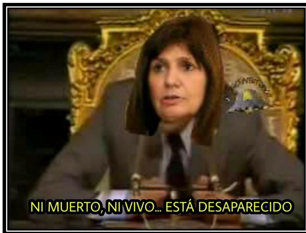
Fig 9. Meme de Los macrimentarios 45