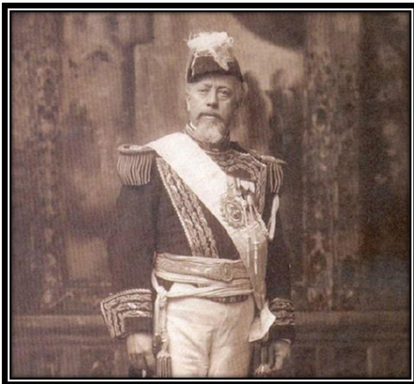
Fig 6. Meme de El Cipayo 39

En primer lugar, habría que señalar que la enunciación que prevaleció fue la de lo cómico cínico. El enunciador degradó el blanco mediante la burla invitando al enunciatario a ser cómplice del placer de lo risible agresivo. Esa degradación se realizó mediante la incorrección política en relación a ciertos principios morales extendidos con la llegada de la democracia, luego de la última dictadura. Nos detendremos en dos ejemplos para ilustrarlo. Apenas el caso ocupó la agenda mediática, El Cipayo publicó el siguiente meme: