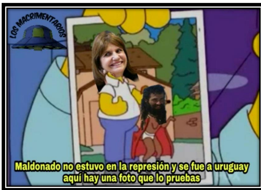
Fig. 11 Meme de Macrimentarios 47

Como habíamos planteado más arriba, lo reidero en los memes se da en la articulación de diferentes dimensiones. En ambos memes el blanco de la sátira no es Maldonado sino que, en uno, es Mirtha Legrand, la afamada conductora de televisión, y el lugar común que justificó los delitos de lesa humanidad de la