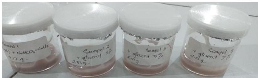
Gambar 3. Edible coating dari pektin kulit durian

Pada penelitian ini tidak dilakukan proses dekolorisasi pada serbuk pektin yang dihasilkan sehingga bila serbuk tersebut dicampurkan dengan \text{NaHCO}_3 , \text{CaCl}_2 , dan gliserol, akan dihasilkan gel kental berwarna merah muda seperti yang dapat dilihat pada Gambar 3. Gel tersebut digunakan sebagai pelapis pada cabai rawit merah untuk memperpanjang masa simpan.