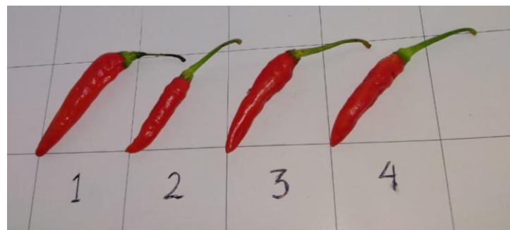
Gambar 1. Warna cabai setelah 15 hari

Selain susut bobot, penambahan gliserol juga berpengaruh pada warna cabai rawit merah setelah penyimpanan 15 hari. Aplikasi edible coating tidak membuat warna cabai merah berubah bahkan warnanya tetap saja sama seperti hari ke 0, sehingga penambahan coating tidak berpengaruh pada penurunan kualitas warna pada cabai merah.