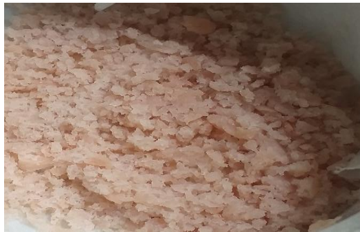
Gambar 2. Serbuk pektin hasil ekstraksi kulit durian

Hasil dari ekstraksi refluks menggunakan HCl pada kulit durian akan menghasilkan padatan serbuk seperti yang dapat dilihat pada Gambar 2. Proses ekstraksi kulit durian menghasilkan pektin yang berwarna merah muda. Pada penelitian tentang ekstraksi pektin yang sebelumnya telah dilakukan Cserjesi dkk (2011), hasil serupa juga didapatkan. Pektin yang didapatkan dari ekstrak kulit buah-buahan akan berupa serbuk dengan warna yang beragam dari ungu kemerahan hingga kuning, bergantung dari jenis kulit buah yang digunakan. Hal ini dikarenakan adanya zat yang menghasilkan warna yang terikut terekstrak oleh pelarut yang digunakan. Untuk didapatkan serbuk pektin yang tidak berwarna, pektin komersial akan melalui proses dekolorisasi. Proses ini dapat dilakukan dengan metode fisis maupun kimia (Xie dkk., 2008)