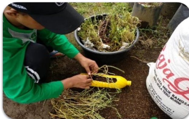
Gambar 5. penanaman bunga krokot di dalam botol bekas

Selain penambahan bibit stroberi, juga penanaman bunga krokot di dalam botol bekas berukuran 1500 mL yang sebelumnya sudah dicat terlebih dahulu dan diberi gantungan kawat.