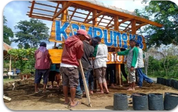
Gambar 3. Merenovasi papan nama Desa Wonoayu

Dalam tahap ini, kegiatan yang akan dilakukan adalah pembersihan lahan, pendatangan bibit dan penanaman, penataan lahan dan terakhir dilanjutkan dengan pembuatan vertikal garden.