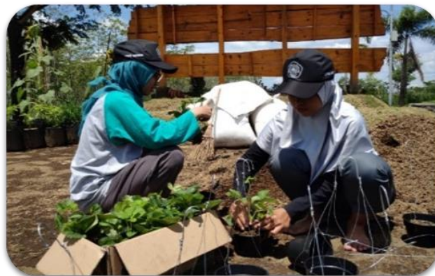
Gambar 4. penanaman bibit stroberi dalam polybag

Kegiatan selanjutnya adalah penanaman bibit stroberi dalam polybag yang dibantu dengan para Wanita Tani Desa dan ibu-ibu PKK. Penanaman bibit stroberi dilakukan sebagai bagian dari program kerja yaitu penambahan bibit di greenhouse dan lahan demplot serta sebagai pengganti tanaman yang tidak terawat dalam jumlah 100 bibit.