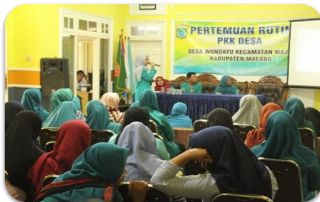
Gambar 2. Kegiatan sosialisasi dengan kelompok Wanita Tani Desa dan ibu-ibu PKK

Kegiatan awal yang dilakukan di Desa Wonoayu Kecamatan Wajak adalah sosialisasi dengan kelompok Wanita Tani Desa dan ibu-ibu PKK. Sebelum diadakan sosialisasi dengan para Wanita Tani Desa dan PKK, kami menemui para pihak Pemerintah Desa dan berbicara mengenai kegiatan yang akan dilakukan selama 1 bulan di Desa Wonoayu serta rencana kami melaksanakan kegiatan Sosialisasi yang akan dilaksanakan di Balai Desa pada tanggal 5 Februari 2020. Kegiatan sosialisasi dilaksanakan untuk mencari mitra dalam penambahan bibit pembenahan fasilitas di greenhouse .