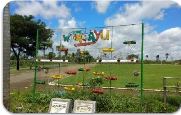
Gambar 6. Penambahan fasilitas spot foto