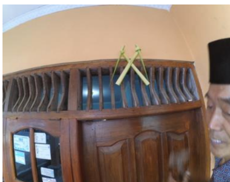
Gambar. 5 Janur Penolak Balak (Dokumentasi pribadi, 2019)

yaitu depan pintu rumah, sisi samping rumah dan sisi belang rumah.