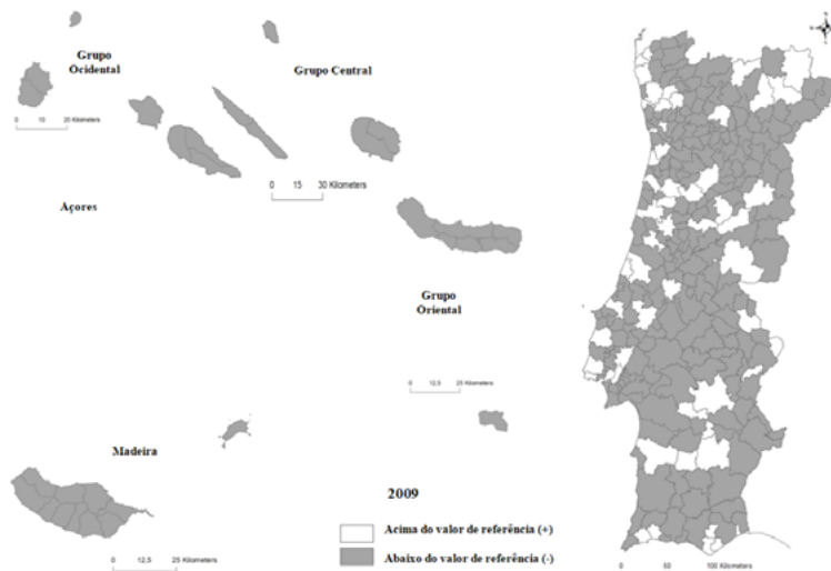
Figura 1: Representação cartográfica dos resultados WeGlx para o ano 2009

A representação cartográfica dos resultados para os anos 2009 e 2015 encontra-se visível, respetivamente, nas Figuras 1 e 2.