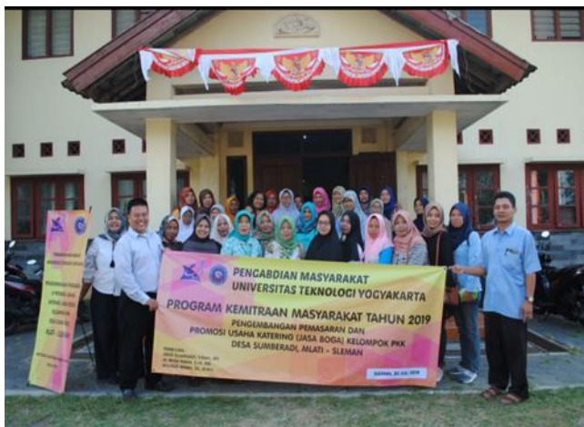
Gambar 7. Foto Bersama setelah Pelatihan