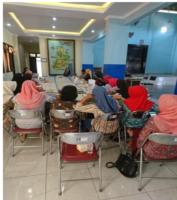
Gambar 6. Suasana Pelatihan

Tahapan selanjutnya adalah melakukan pelatihan pada anggota PKK usaha catering bagaimana cara mengoperasikan dan mengelola website untuk usaha catering (Gambar 6 dan Gambar 7). Berdasarkan hasil pelatihan diperoleh bahwa website yang telah dibuat sangat bermanfaat dalam pengembangan pemasaran usaha catering dan mempermudah pengelolaan keuangan karena sudah tersistem dengan baik.