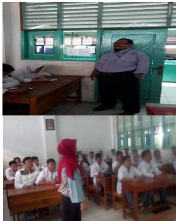
Gambar 3. Narasumber dan peserta (pemberian materi)