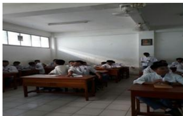
Gambar 2. Peserta penyuluhan kelas XII TKR B