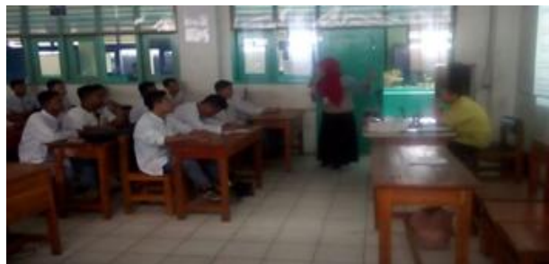
Gambar 1. Peserta penyuluhan kelas XII TKR B

ditempuh melalui mekanisme class action, legal standing, gugatan ke PTUN.