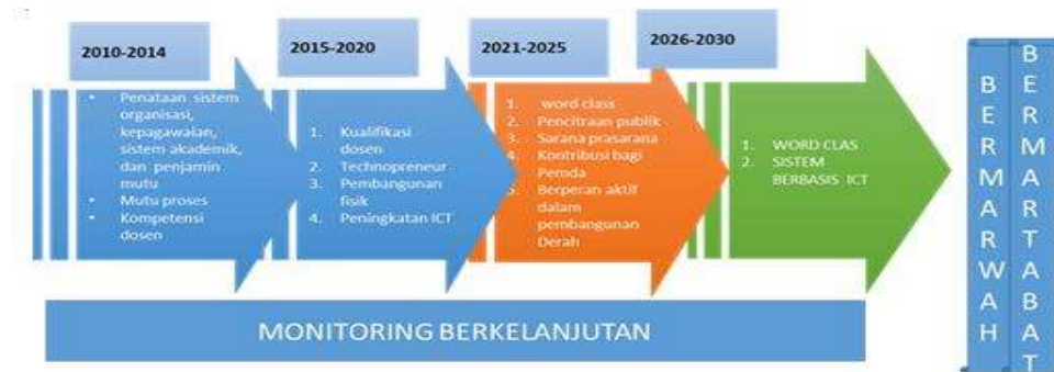
Gambar.3. Tahapan yang akan dicapai untuk mewujudkan Visi UMRI

Tahapan menuju universitas yang bermarwah dan bermartabat membutuhkan upaya yang sungguh-sungguh dari seluruh komponen civitas akademika UMRI dalam meningkatkan kualitas di segala bidang terutama yang berkaitan dengan :