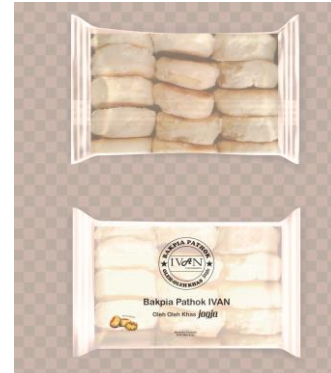
Gambar 3. Bakpia Kemasan Plastik

ini, mitra perlu pendampingan yang intensif, mengingat bahwa mereka sudah nyaman dengan pola pengemasan yang lama dan juga pertimbangan terbesar ada pada biaya produksi kemasan yang akan mengubah harga jual. Kemasan berupa plastik dapat dilihat pada gambar berikut :