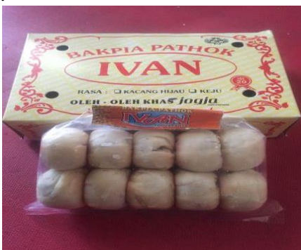
Gambar 1. Kemasan Plastik dan Kardus

Dari sisi harga, produk bakpia ini memang menasar pada segmentasi kelas menengah ke bawah dengan sistem penjualan langsung ke konsumen atau para pedagang makanan. Sedangkan untuk packaging produk dengan kemasan kotak atau dus hanya diperuntukkan bagi konsumen yang memesan dengan jumlah tertentu dan biasanya diperuntukkan sebagai oleh-oleh. Berikut gambar packaging bakpia ivan :