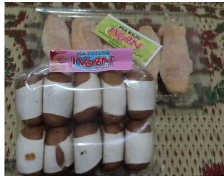
Gambar 2. Bakpia rasa keju dan coklat (gula jawa)

Varian rasa bakpia ivan ini juga dikemas dengan cara yang sama. Menurut penuturan pemilik, pernah mereka menggunakan alat press plastik ( hand sealer ), tapi ternyata menurut mereka proses itu memakan waktu sehingga tidak bisa dilakukan secara efisien, sehingga mereka kembali ke cara yang lama, yaitu dengan steples. Varian produk / rasa bisa dilihat pada gambar berikut :