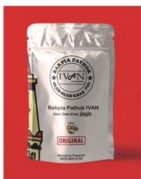
Gambar 4. Kemasan plastik B

Ukuran dari kemasan dengan panjang 15 cm, lebar 10cm, berisi 15 butir bakpia dalam satu kemasan. Harga kemasan dengan model seperti ini tujuh ratus lima puluh rupiah per plastik.