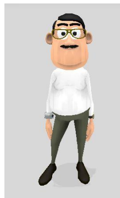
Gambar 4 Tokoh Ayah

Ali merupakan adik dari Yusuf di dalam film pendek animasi tiga dimensi. Ali adalah pribadi yang periang, bersemangat, percaya diri, cengeng dan rasa ingin tahunya yang besar. Karakter Ali menggambarkan karakteristik anak usia dini yang termasuk kedalam tahap pra operasional kongkrit. Tokoh Ali dikemas menggunakan menggunakan pakaian atasan warna hijau dan pakaian bawahan warna hitam, dimana pemilihan warna tersebut bertujuan untuk menarik perhatian peserta didik.