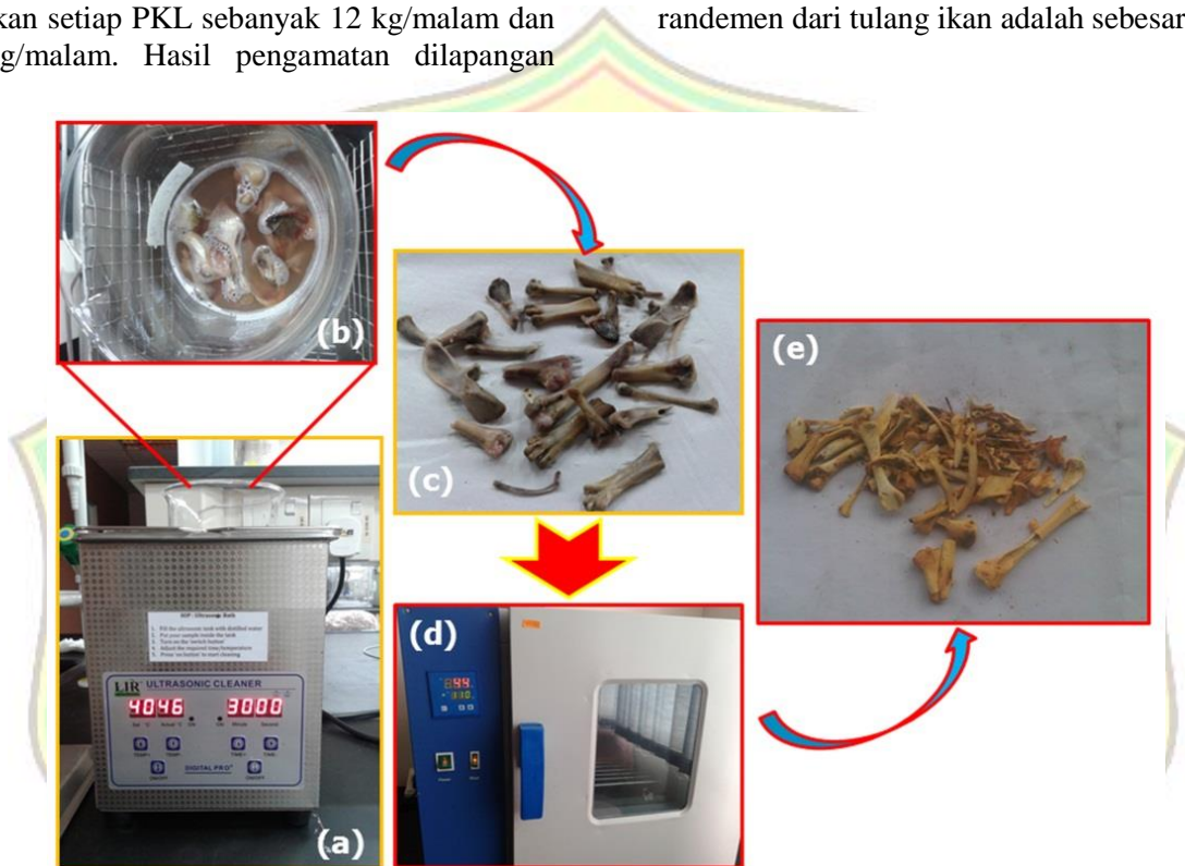
Gambar 2. (a) & (b) pencucian tulang dengan NaOH dalam ultrasonic cleaner (c) tulang yang sudah bersih (d) proses pengeringan tulang dengan oven pada 100 °C (e) tulang yang sudah kering.

menunjukkan bahwa 1 kg ayam utuh dapat menghasilkan 73 gram tulang ayam bila proses memasak dengan bakar. Sedangkan 51 gram untuk ayam yang dimasak dengan proses goreng. Dari kedua proses pengolahan ayam (proses dibakar dan digoreng) diambil rata-ratanya, yakni 62 gram. Artinya randemen dari limbah tulang ayam dari PKL adalah 6.2% dari berat ayam 1000 gram. Sedangkan untuk 1 kg ikan hanya menghasilkan tulang ikan sebesar 14 gram (dimasak dengan proses goreng) atau randemen dari tulang ikan adalah sebesar 1.4%.