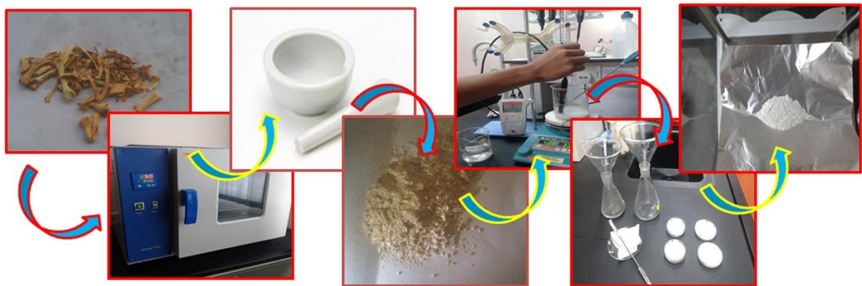
Gambar 3. Proses pembuatan serbuk tulang sampai serbuk tulang berukuran nanopartikel

Randemen serbuk tulang ayam untuk serbuk tulang ayam didapat sebesar 8.4 gram / 62 gram)X 100% = 13.5%. Sedangkan untuk tulang ikan randemen yang diperoleh sebesar (3.1 gram/14 gram)X 100% = 22.1%.