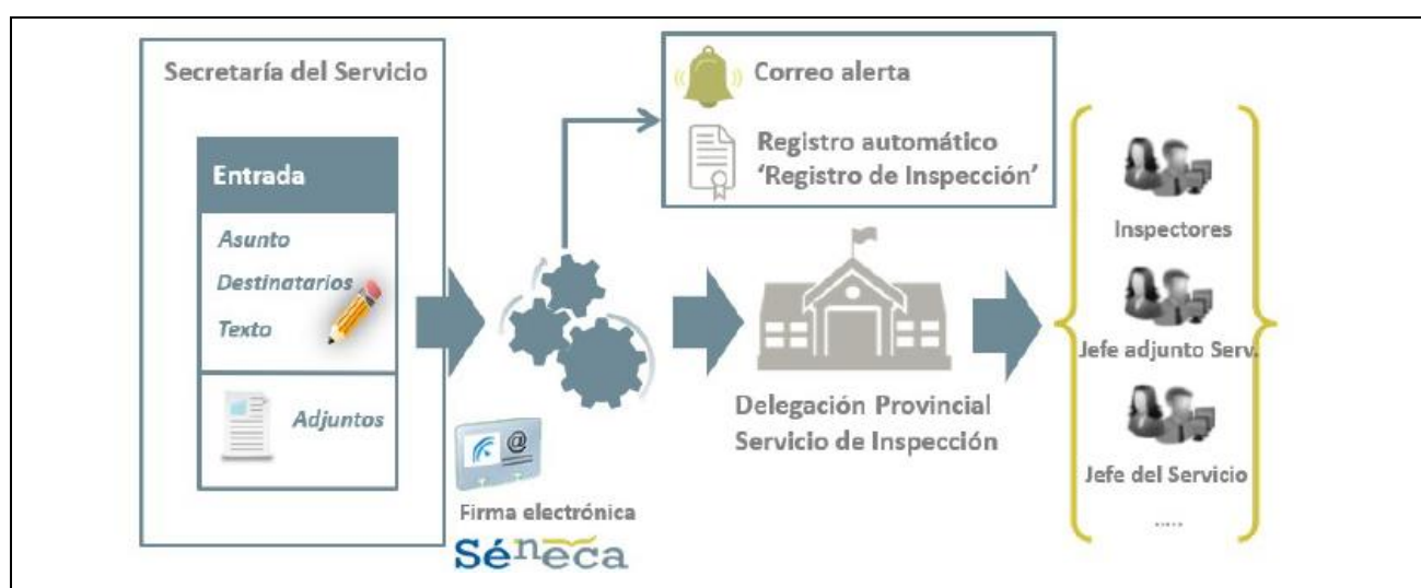
Gráfico 3: Esquema abreviado del registro informatizado de procedimientos de la Inspección Educativa en el Sistema de información Séneca.

Otros de sus elementos fundamentales será la explotación y seguimientos de los datos de gestión asociados a las actuaciones del Plan General de la Inspección Educativa de Andalucía, debiéndose facilitar también en futuros desarrollos “la comunicación entre el nuevo módulo de Registro de Inspección con otros módulos del Sistema Séneca, que puedan ser candidatos a constituirse en fuente de entradas para ser gestionadas por la Inspección” (Silveira, 2019).