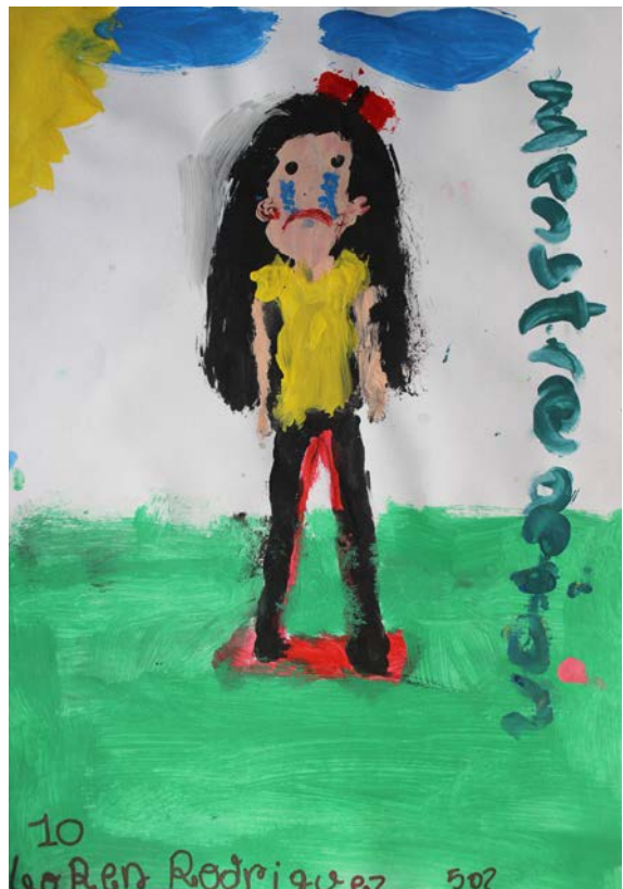
Imagen 1. Serie de pinturas estudiantes grado 5. (Bogotá, 2015). Colegio la Toscana Lisboa.