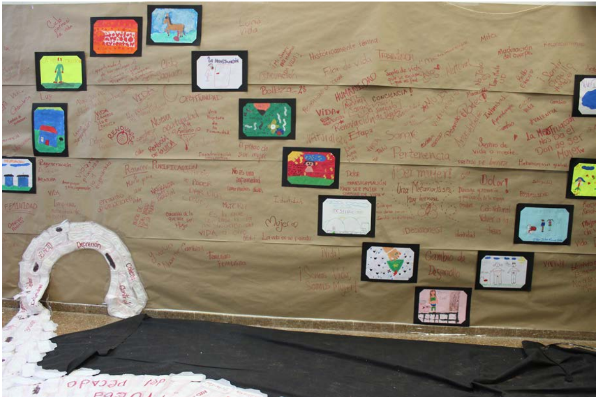
Imagen 2. De la discriminación a la contemplación: Una experiencia estética de la menstruación en la escuela. (Instalación, abril 2016). Proyecto UAQUE Universidad Distrital Francisco José de Caldas.