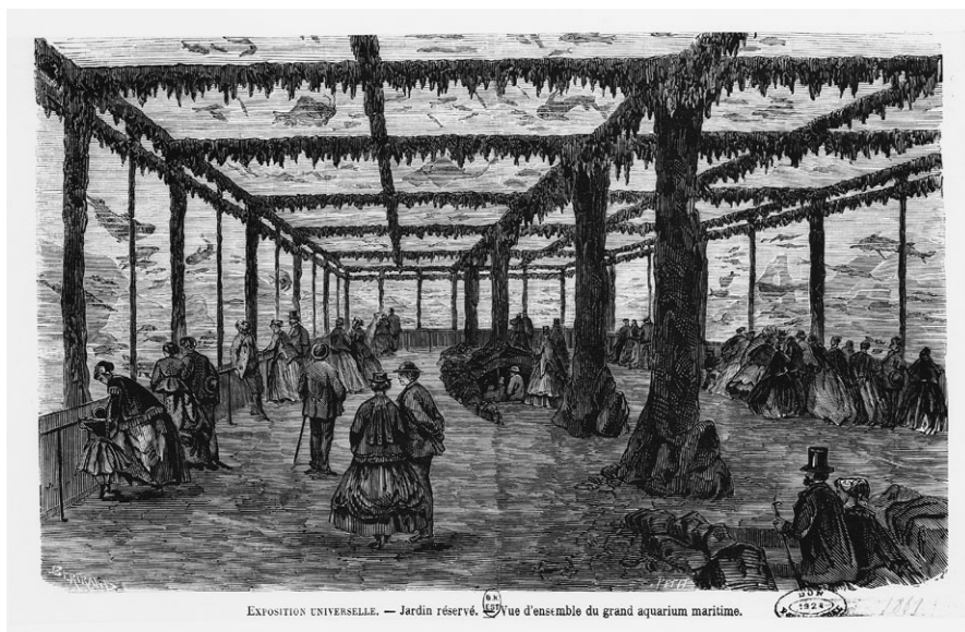
EXPOSITION UNIVERSELLE. — Jardin réservé. Vue d'ensemble du grand aquarium maritime.

Dieser Vorgang soll abschließend an Hans Christian Andersen dargestellt werden, der die Pariser Weltausstellung besuchte und dies auf seine ganz persönliche Art in dem Märchen The dryad verewigte. Eine Waldnymph setzt alles in Bewegung, um der Ausstellung ansichtig zu werden, und lässt sich auch nicht durch die Vorhersage abbringen, dass ihre Lebenszeit sich durch diesen Ausflug unwiderruflich auf einen halben Tag verkürzen wird. Die Dryade kommt auf ihrem Weg zum Marsfeld zunächst an den während der Dauer der Ausstellung geöffneten, neu gestalteten Pariser Katakomben vorbei, und damit an einem Ort, der sich in das diskursive Umfeld der Ausstellung einschreibt. Andersen führt nach und nach eine ganze Reihe spezifischer Weltausstellungsmotive ein. Er verwandelt die Ausstellung dabei jedoch von einer wissenschaftlich-ideologischen Fortschrittsschau in ein