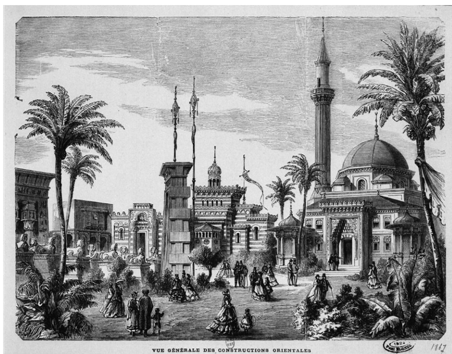
Nationalpavillons im Park der Ausstellung.

Außerdem war vielen daran gelegen, von der Ausstellung anders als nur geistig zu profitieren. Und gerade die Pariser erwiesen sich beim Aufspüren von Verdienstmöglichkeiten rund um das Marsfeld als ausgesprochen kreativ. Im Lauf des Sommers eröffneten Druckereien von Visitenkarten, Regenschirmverleihe, Photostudios und Übersetzungsbüros auf dem Ausstellungsgelände. Vor den Toren wurden selbst gebastelte Kataloghalter und gefälschte Eintrittskarten angeboten. In der restlos überfüllten Stadt stiegen die Hotelpreise um das Drei- bis Vierfache, und Tausende von Parisern vermieteten ihre Privatwohnungen zu horrenden Preisen.