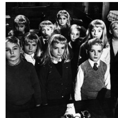
Abbildung 24: Village of the Damned (1960), Wolf Rilla, Todbringende Kinderaugen

Hier mutieren Dutzende, parallel gezeugte, infantile inhumane Geschöpfe zu Trägern des Furios-Bösen. Die weißhaarigen Kinder sind untereinander telepathisch verschaltet und können durch ihre Blicke die Aktionen anderer Menschen zu ihren Gunsten und deren Ungunsten lenken. Auch hier liegen Grauen und Andersartigkeit im Signifikanten Auge verborgen, das ebenfalls durch Vervielfältigung besticht.