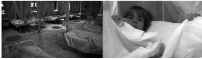
Abbildungen 20 und 21: The Boys from Brazil (1978), Franklin J. Schaffner, ‚Schöne Neue‘ (Lebensborn-)Welt