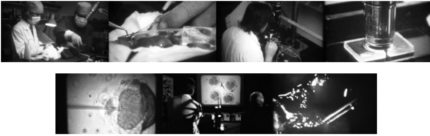
Abbildungen 6 bis 12: The Boys from Brazil (1978), Franklin J. Schaffner, ‚Gute‘ seriöse Wissenschaft klonst Kaninchenblutzellen

Sodann folgt eine mikroskopische Großaufnahme einer der extrakorporalen unbefruchteten Eizellen. Ihr genetic make-up , ihre Chromosomen, Gene werden durch ultraviolettes Licht zerstört. 32 Der Nukleus der Spender-Blutzelle eines schwarzen Kaninchens wird in die „entkernte“ Eizelle mikroinjiziert. Mehrere auf diese Weise befruchtete Eizellen werden in das Uterusgewebe des weißen Kaninchens eingepflanzt. Und nun der Clou: Innerhalb eines Monats wachsen sie zu schwarzen Babykaninchen heran. Diese reproduktionsmedizinische Fantasie – die fiktive Geburt schwarzer Klonkaninchen durch ein weißes Leihmutterkaninchen – stellt eine euphorisierende und verfälschende Behauptung des Medizinfilms im Spielfilm dar, der die damalige Realität nicht standhalten konnte. 33