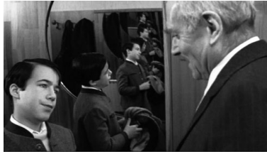
Abbildungen 22 und 23: The Boys from Brazil (1978), Franklin J. Schaffner, Vielfach-Hitler-Klon, Filmposter – plurale Zellteilung versus männliches Singulärsubjekt