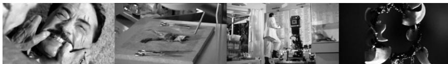
Abbildungen 2 bis 5: The Boys from Brazil (1978), Franklin J. Schaffner, Inszenierungen Mengeles: Zähnefletschen, sezierter Frosch, pedantische Listen, Leitmotiv Haifischzahnkette

ner Gefolgsleute. Mengele wirkt diabolisch, gespenstisch, sagenumwoben – ein kongenial-besessener Wissenschaftler oder „utopischer Herrscher“; 20 auf den die (seinem fanatischen Wunsch nach nationalsozialistische) Nachwelt einmal mit Bewunderung aufblicken soll. Im Verlauf des Films wird er als pedantisch, gelegentlich cholerisch und voll des eiskalten Kalküls gezeichnet. Um zu visualisieren, dass er überdies gewalttätig ist, wird in seinem Labor beispielsweise die Großaufnahme eines seziierten Frosches gezeigt, der alle Viere von sich streckt. Beim Endkampf der Antagonisten wird der Zähne fletschende Mengele mit aggressiven Hunden analogisiert und damit animalisiert: