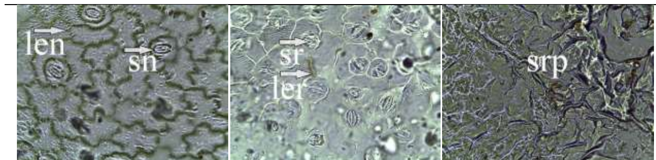
Gambar 3. Jaringan epidermis bawah daun gulma Asystasia genetica yang diaplikasi kombinasi asam asetat dan ekstrak buah lerak dengan pembesaran mikroskop 100 x 10 µm sn : stomata normal, len : lekukan epidermis normal, sr : stomata rusak, ler : lekukan epidermis rusak, srp : struktur rusak parah

Struktur stomatadaun gulma Asystasia genetica menunjukkan bentuk stomatadaun dan lekukan epidermis daun gulmayang diaplikasi berbagai kombinasi asam asetat dan ekstrak buah lerak.