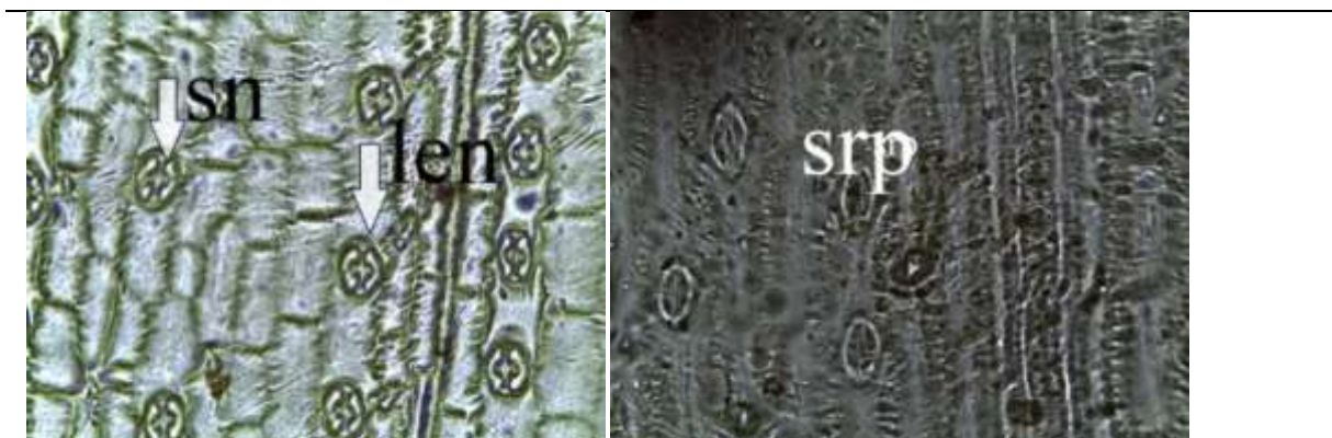
Gambar 1. Jaringan epidermis bawah daun Paspalum conjugatum yang diaplikasi kombinasi asam asetat dan ekstrak buah lerak dengan pembesaran mikroskop 100x10 µm sn : stomata normal, len : lekukan epidermis normal, srp : struktur rusak parah

Struktur stomata daun Paspalum conjugatum menunjukkan bentuk stomata daun dan lekukan epidermis daun gulma yang diaplikasi berbagai tingkat kombinasi asam asetat dan ekstrak buah lerak.