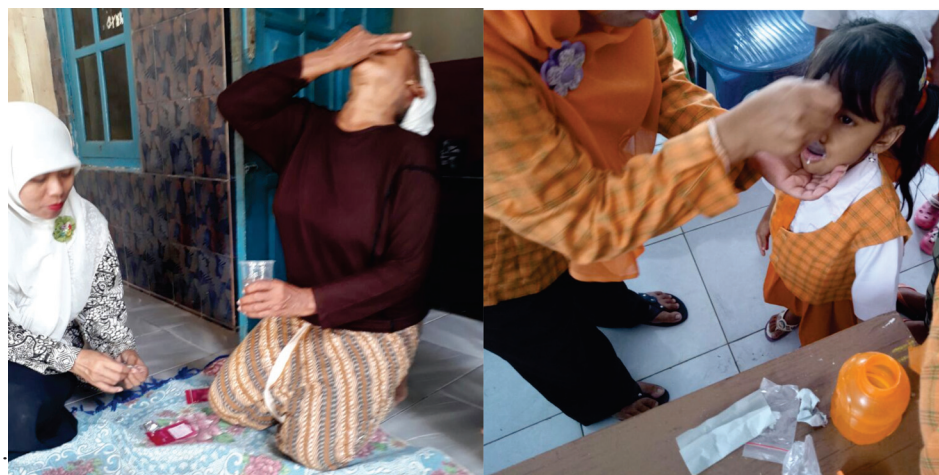
Gambar 2. Dokumentasi Dinas Kesehatan Kabupaten Pekalongan pelaksanaan POPM filariasis dengan meminum obat langsung di hadapan petugas kesehatan, gambar kiri petugas mendatangi warga dan gambar kanan petugas mendatangi sekolah.

Kegiatan Pemberian Obat Pencegahan Massal (POP) dimulai dengan memetakan daerah endemis