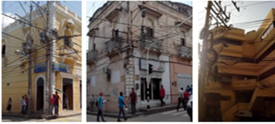
Figura 2. Contaminación visual por redes de cableado eléctrico.

publicitarios. En ese sentido, se estima un porcentaje del 22% para la contaminación visual generada por avisos publicitarios. Ver figura 3.