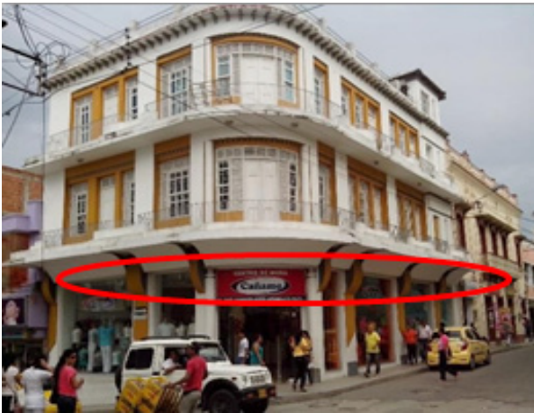
Figura 3. Contaminación visual por avisos publicitarios.

publicitarios. En ese sentido, se estima un porcentaje del 22% para la contaminación visual generada por avisos publicitarios. Ver figura 3.