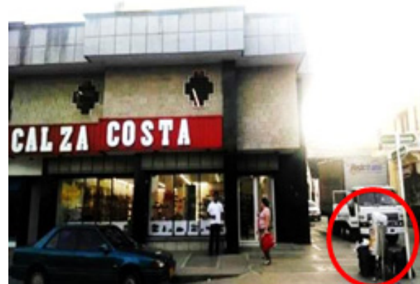
Figura 5. Contaminación visual por disposición indebida de basuras.

En última instancia se identificó el contaminante visual producto de la indebida disposición de basuras con un porcentaje del 1%. Ver figura 5.