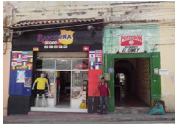
Figura 4. Contaminación visual por fachadas de edificaciones en mal estado.

El quinto lugar de contaminantes visuales identificados lo ocupa el generado por el comercio informal, el cual presenta un porcentaje del 9%.