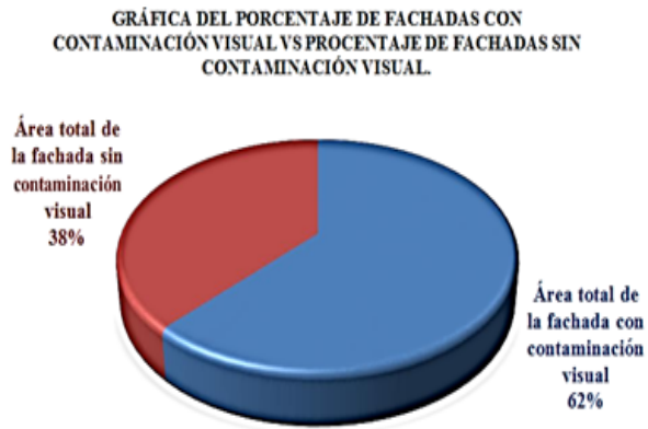
Figura 6. Porcentaje de fachadas con contaminación visual en el centro de Sincelejo.

De acuerdo con lo anterior, se establece que en las fachadas, es mayor el área contaminada por elementos visuales que el área que no posee este tipo de contaminantes, ya que el área de fachadas con contaminantes visuales es de 28772,62m 2 frente al área de fachadas sin contaminantes visuales la cual es de 17634,83m 2 .