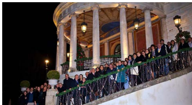
Foto di gruppo alla cena di gala tenutasi alla Casina Valadier

In un'atmosfera pienamente prenatalizia, i partecipanti all'evento si sono infine ritrovati alla cena sociale, un evento di marcata eleganza presso la Casina Valadier, incantevole villa realizzata dal noto architetto Valadier immersa nei giardini del Pincio. La cena con vista su una