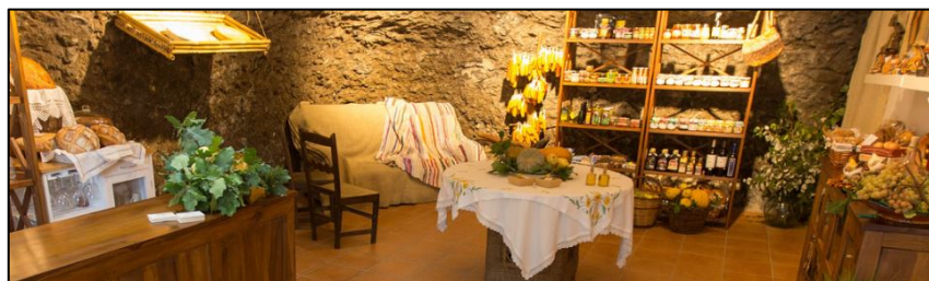
Figure 2. Shop of the Gastro-Cave Arte-Gaia