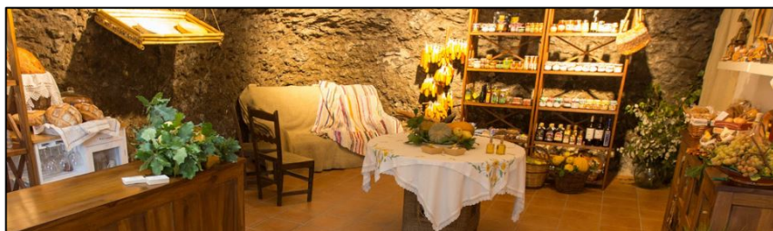
Figura 2. Tienda de la Gastro-Cueva Arte-Gaia