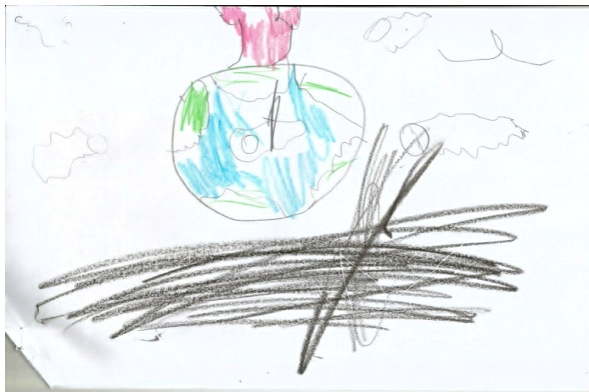
Figura 4. Desenho colorido, Aluno 4.

En la Figura 3 tenemos la predominancia de los colores azul y verde, en tonalidades diferentes, donde el azul significa tristeza, pero también representa calma. Y el verde significa que emocionalmente se trata de un individuo débil, que cualquier motivo lo lleva al cambio extremo del humor. Las características positivas de este color representan la seguridad, el coraje y la esperanza. El amarillo y el rojo representan la fuerza a la violencia, que pueden ser traducidas en rabia negativamente, y positivamente el amarillo representa la alegría.