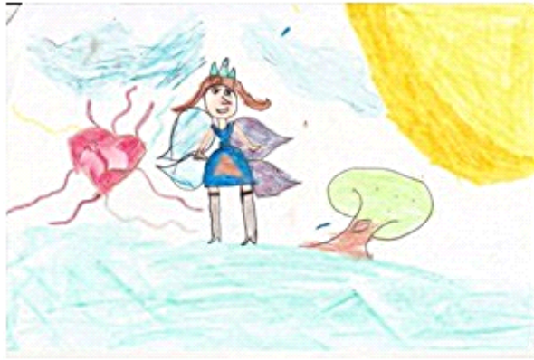
Figura 3. Desenho colorido, Aluno 3.