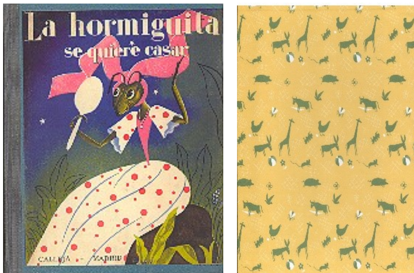
Figura 2. Cubierta y guarda de La hormiguita se quiere casar . Servicio de Publicaciones UCLM, 2005.

Desde entonces se han recuperado un total de catorce títulos (Anexo 1) entre los que se encuentran algunos que han “sufrido” parecidas situaciones: Polilla y la pizarra del rey Melchor , nuestra Alicia en el país de las maravillas , Navidad: villancicos, pastorelas, posadas, piñatas 3 , entre otros; y cuyos estudios previos de carácter introductorio, a cargo de especialistas en la materia, han sido de enorme utilidad a la crítica literaria especializada, y al público amante de la LIJ más clásico, a la hora de reivindicar sus textos, autores, ilustradores y editoriales primigenias.