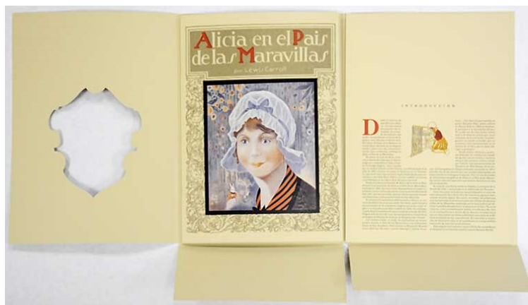
Figura 3. Detalle de encuadernación de Alicia en el País de las Maravillas . Servicio de Publicaciones UCLM, 2015.

objetivos prioritarios. Además de ser un fiel reflejo de la obra original (técnicamente se trata de ediciones quasi facsimilares ), se han adaptado a las características del álbum ilustrado actual. Queremos destacar la introducción de guardas ilustradas 4 a partir de la reproducción en 2005 de La hormiguita se quiere casar , generalmente a partir de la repetición de un motivo relacionado con alguna ilustración del original. Todas estas ediciones suelen realizarse con encuadernación en tapa dura (no necesariamente coincidente con el original), para garantizar la mejor preservación y presentación de la edición facsimilar contenida en el corpus del libro. Si bien es cierto que, en este apartado, el proyecto editorial de cada título se ha ido adaptando al mejor producto final considerando las características propias del original reproducido, y su puesta a disposición del público (i.e.: Alicia en el País de las Maravillas ).