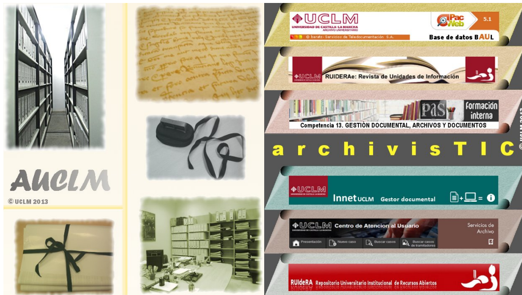
Imagen 1 Folleto ArchivistIC 2013

especializados en archivos y documentación como los mapas interactivos, las exposiciones virtuales, la agenda profesional o la selección de novedades bibliográficas que se siguen manteniendo, evolucionando y adaptándose al nuevo concepto y contexto.