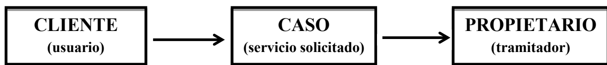
Imagen 4 Elementos del CRM

En la aplicación intervienen básicamente tres elementos: cliente, caso y propietario, como se muestra en la imagen.