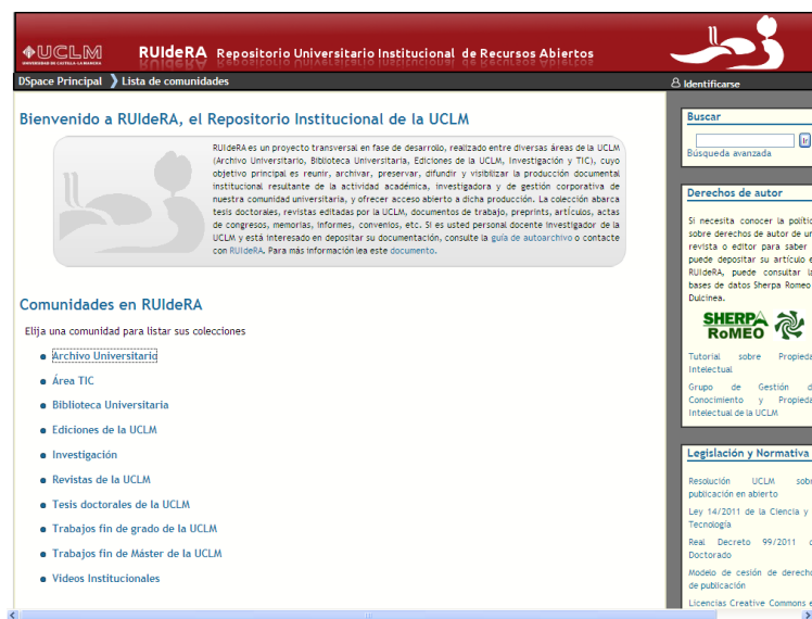
Imagen 3 Página de inicio de RUIDeRA https://ruidera.uclm.es

RUIDeRA almacena actualmente cerca de 2.000 documentos en formato digital de diversa tipología como monografías, artículos, publicaciones periódicas, memorias, informes, tesis doctorales, trabajos de investigación, publicaciones oficiales, normativa institucional y también documentación histórica producidos todos ellos bien por la UCLM, bien por cualquier miembro de su comunidad universitaria: personal de administración y servicios, personal docente e investigador o estudiantes.