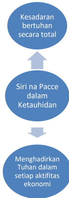
Gambar 1 (Ilustrasi Peneliti) Wujud Siri' na Pacce dalam ketauhidan